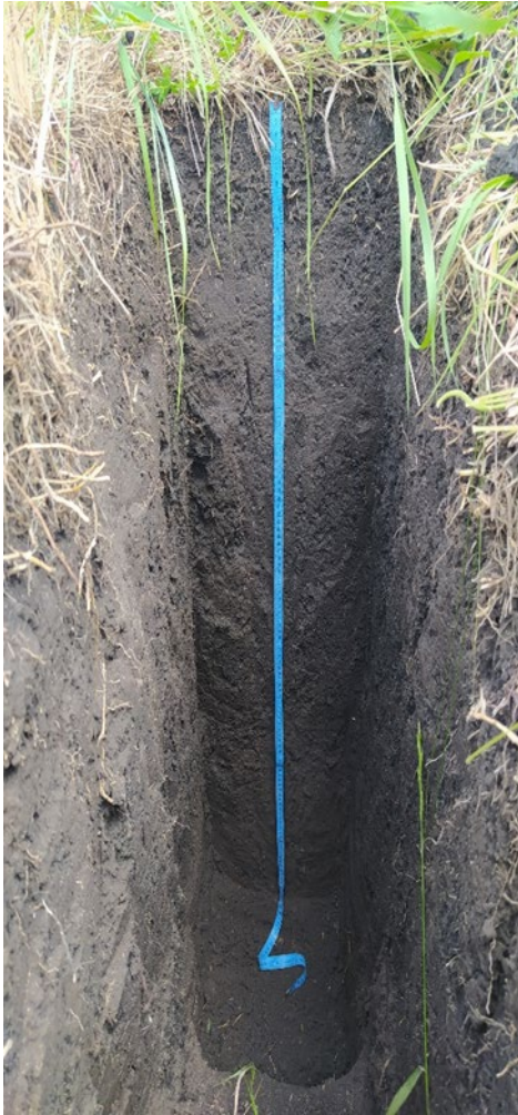
Рис. 2. Чорнозем лучний ( Luvic Phaeozem (Pachic) )