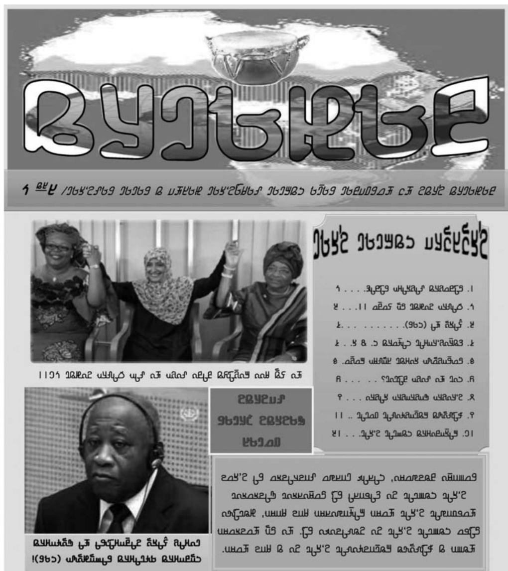
Рис. 4. Фрагмент першої смуги щомісячника «Табальде» Tabalde , номер 2 (2011 року) алфавітом аддам. На фото посередині – лауреати Нобелівської премії миру за 2011 рік: правозахисниці Лей-ма Гбвее (Leymah Gbowee) з Ліберії та Таваккол Карман (Tawakkol Karman) з Ємену і президент Ліберії Елен Джонсон Серліф (Ellen Johnson Sirleaf), у нижній частині – фото колишнього прези-дента Кот-д’Івуару Лорана Гбарбо (Laurent Gbagbo)