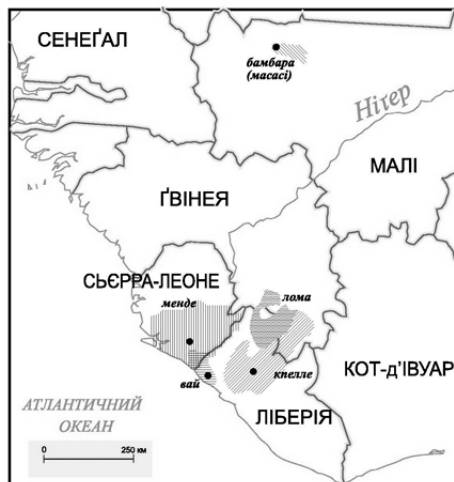
Рис. 1. Території в Західній Африці, де поширені мови манде, для яких було створено силабарії [2]

Під впливом вайської писемності внаслідок так званої «дифузії стимулу» виникла низка силабаріїв для сусідніх мов манде: кпелле (Kpelle, Guerzé, Kpwessi), лома (Loma, Looma, Lɔma, Toma), менде (Mende), а також, вірогідно, одного з діалектів бамана (бамбара; Bamana, Bambara, Bamana[n]kan), див. рис. 1.