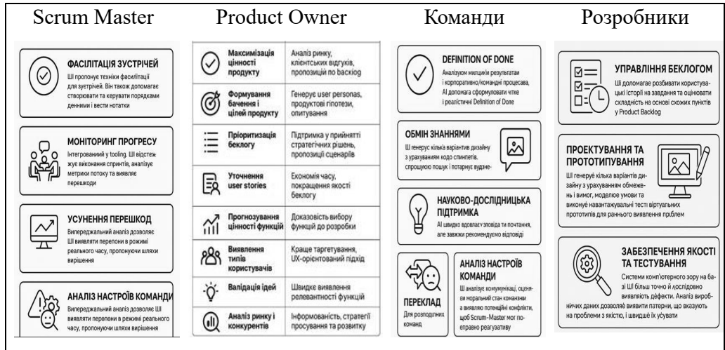
Рис. 3. Ролі Ш-асистентів у SCRUM