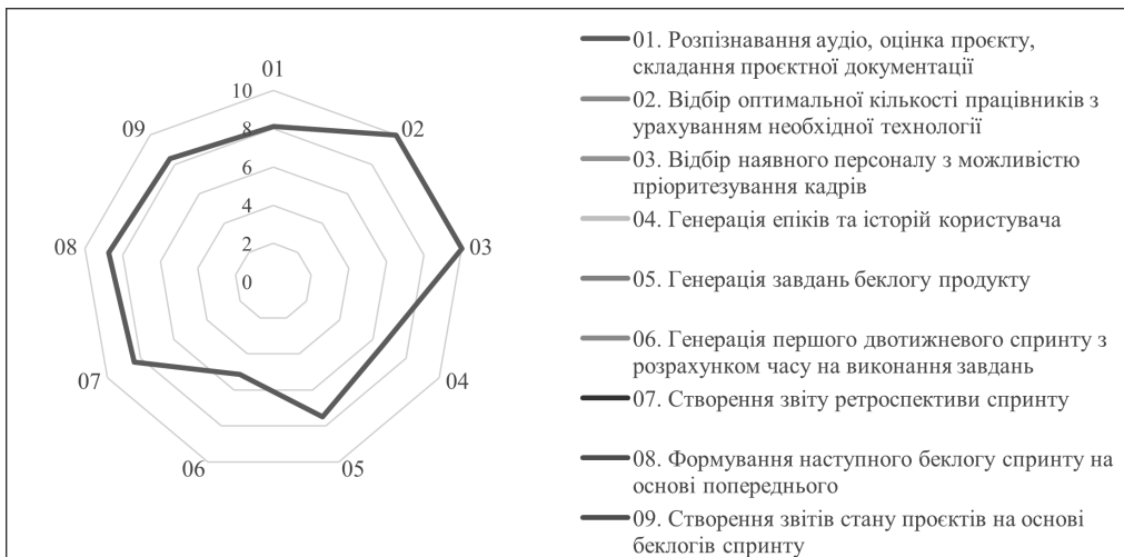
Рис. 6. Візуалізація оцінки ефективності ШІ у виконанні конкретних задач

Зокрема в науково-дослідницькій роботі Р. Ніколенка засобами NotebookLM на прикладі низки завдань було перевірено ефективність використання ШІ в управлінні за SCRUM двома ІТ-проєктами (рис. 6).