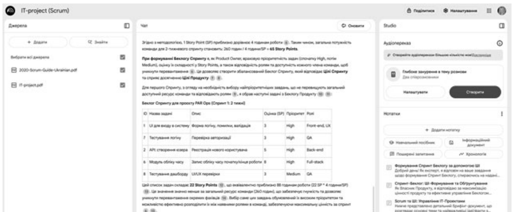
Рис. 5. Фрагмент виконання завдання за промптом з рис. в середовищі NotebookLM