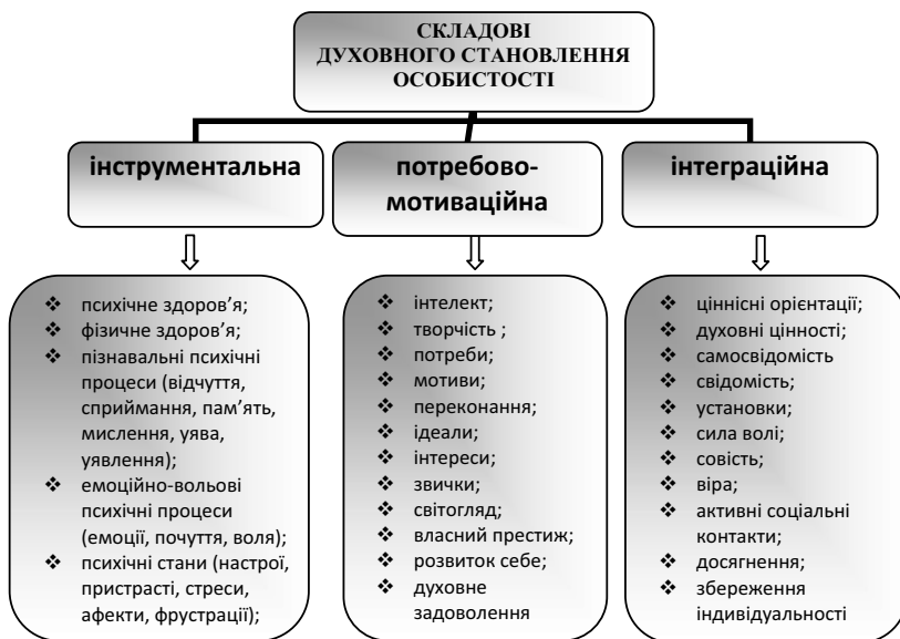
Рис. 2. Авторська модель духовного становлення особистості

Авторська модель духовного становлення особистості включає в себе інструментальну, потребово-мотиваційну та інтеграційну складові (рис. 2).