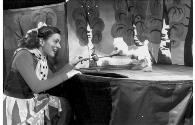
“Гусеня” Н. Гарнет, реж. В. Лісовий, худ. Л.Воробійов, Тернопільський обласний театр актора і ляльки.

Фестиваль “Золотий Лев” – окрема позиція в житті театального Львова. І глядачам, і львівським професіоналам він компенсує брак інформації, дарує нові враження. Усе це дає поштовх до нових цікавих робіт львівських митців і виховує самого глядача.