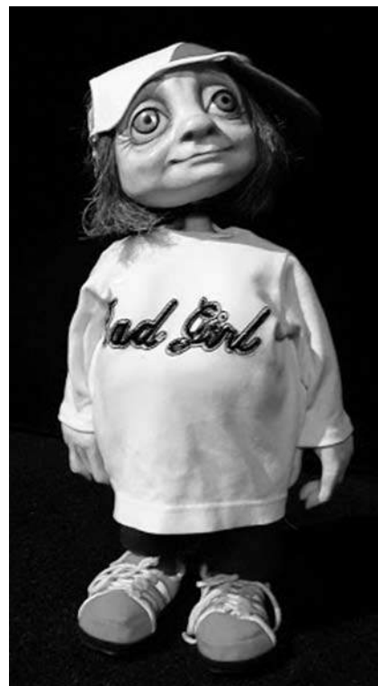
Лялька Бабаня з вистави “Бабаня” К. Рубіної. Режисер – Валерій Бугайов, художник – Віктор Нікітін. Курський державний театр ляльок, 2016 р.

Здавалося, дует постановників досяг найвищих професійних сходинок, і творчий колектив під їхньою орудою мав пишатися такою співпрацею. Та ніби той, паралельний, світ владно диктував свої умови. Без-