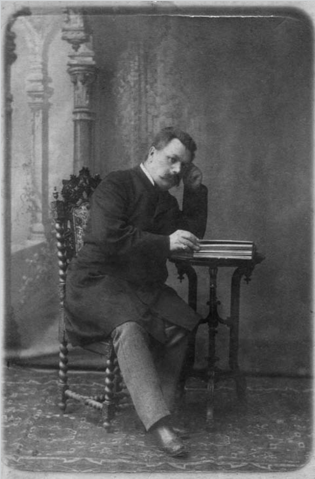
Фотопортрет Марка Кропивницького, подарований Іванні Біберович. Санкт-Петербург, 16 січня (ст. ст.) 1887 р.