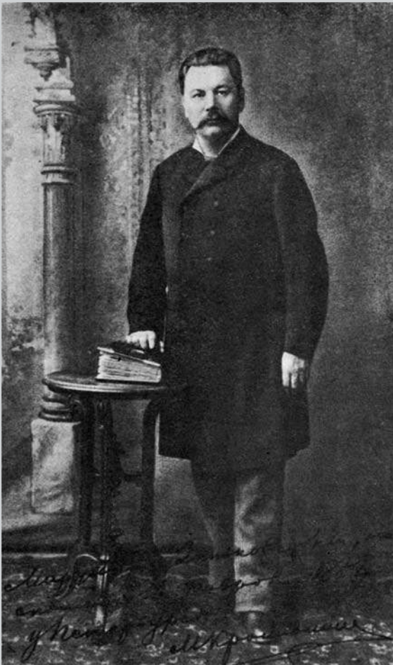
Фотопортрет Марка Кропивницького, подарований Марії Заньковецькій. Санкт-Петербург, 16 лютого (ст.ст.) 1887 р.

новини, поміщеної у львівському часописі “Діло” за 24 січня (5 лютого н. ст.) 1887 р.: “Український театр М. Кропивницького відіграє сім днів в Петербурзі мелодраму Гушалевича “Підгоряни” з прекрасною музикою М. Вербицького” [5]. Інформацію про намір М. Кропивницького у столиці Російської імперії здійснити виставу переробленої ним для своєї сцени галицької мелодрами 3 редакція часопису, мабуть, узяла з його листа. Слід відзначити, що про листування М. Кропивницького з галицькими колегами у тому часі мусимо говорити лише у припущеннях, оскільки цю неоціненну творчу кореспонденцію не пощадило