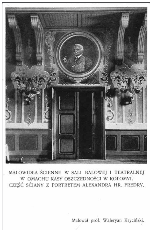
MALOWIDŁA ŚCIENNE W SALI BALOWEJ I TEATRALNEJ W GMACHU KASY OSZCZĘDNOŚCI W KOŁOMYI. CZĘŚĆ ŚCIANY Z PORTRETEM ALEXANDRA HR. FREDRY.

Отже, уклавши з виділом “Руської бесіди” річний контракт про дирекцію в Руському народному театрі терміном на один рік (з 1 травня 1905 р. до 1 травня 1906 р.), М. Садовський прибув із актором