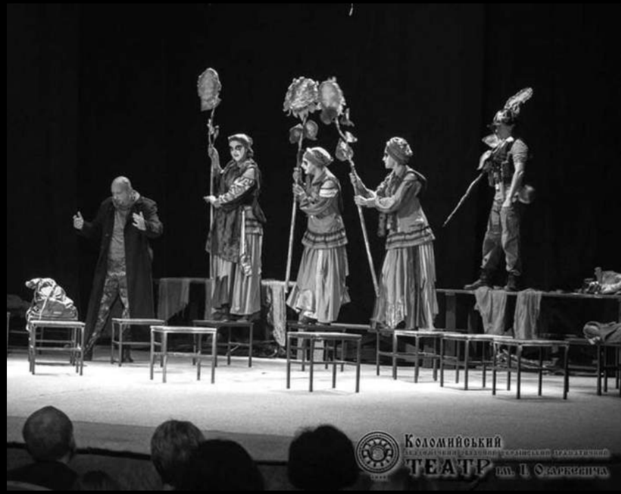
Сцена з вистави “Війни нема... є” В. Волконського за Б. Гуменюком. Режисер – В’ячеслав Волконський. Дніпровський академічний український музично-драматичний театр ім. Тараса Шевченка, 2018 р.

“Образна система вистави, з одного боку, проста і лаконічна, з іншого боку, складна. У реальному світі діють Солдат, його Мати і Лікар. У снах і мареннях навколо Солдата вирують химерні істоти, що вбрані у дивний одяг кольору хакі з червоно-кривавими акцентами та елементами українського національного орнаменту. Обличчя істот – білі маски, на яких чорним гримом відтворено емоцію жаху, агресії, суму. Часом це червоно-чорна маска, яку, залежно від емоції чи світловідчуття, актор вбирає, знімає або змінює. Карнавал жаских страхів, сумнівів і спогадів Солдата підси