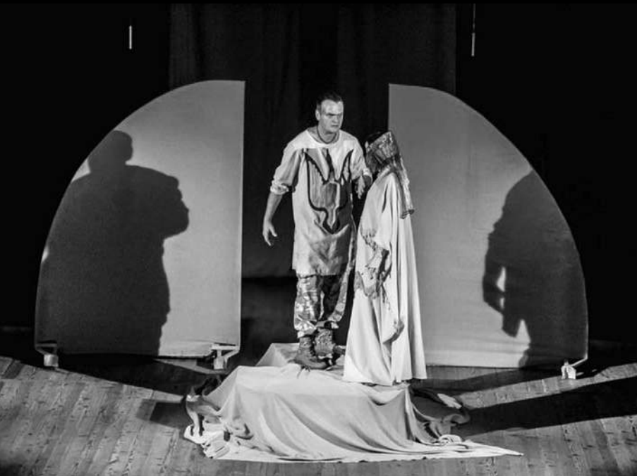
Сцена з вистави “Мойсей” І. Франка. Режисер – Євген Олійник. Миколаївський академічний художній російський драматичний театр, 2018 р.