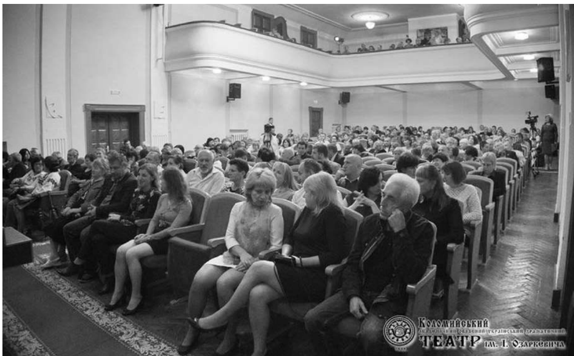
Коломияни в глядній залі перед виставою.