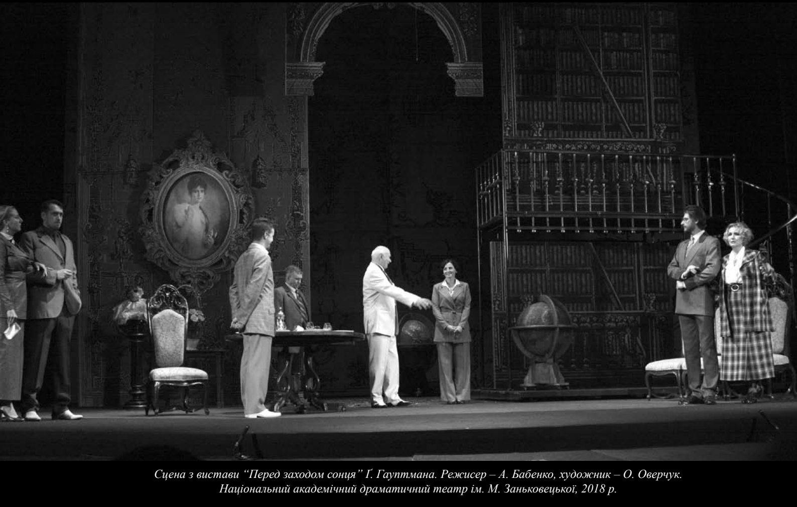
Сцена з вистави “Перед заходом сонця” Г. Гауптмана. Режисер – А. Бабенко, художник – О. Оверчук. Національний академічний драматичний театр ім. М. Заньковецької, 2018 р.

ного радника розбиває вдрузки зрада його дітей, то й академічний спокій резиденції розламається, полишаючи людину сам на сам із її стражданнями на голому планшеті сцени-життя.