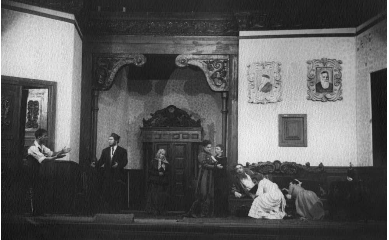
Сцена з вистави "Сендер Бланк" за Шолом-Алейхемом. Київський Всеукраїнський ГОСЕТ, 1939 р.

сват), студент Макс, доктор Лакріц – є справжніми портретами сценічних персонажів, що створюють галерею образів мешканців штетла [10]. Слід зауважити, що протягом 1920-х рр. діяльність М. Епштейна була тісно пов’язана з Культур-Лігою, зокрема з її художньою та театральною секціями. Культур-Ліга, найвпливовіша з єврейських культурних організацій України, ставила собі за мету розвиток їдишської культури – музики, малярства, театру та літератури мовою їдиш. Митці Культур-Ліги активно працювали над створенням та розвитком нового єврейського мистецтва. Саме до цього періоду належать театральні роботи М. Епштейна, що зберігаються у фондовій колекції Музею – близько 30 сценографічних робіт художника.