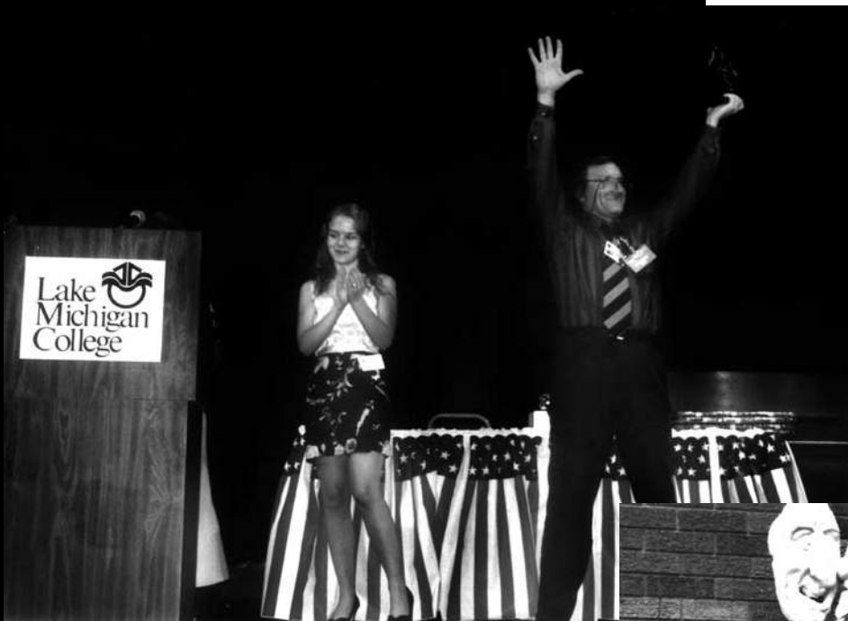
Під час вручення Гран-прі фестивалю “International Theatre Festival” (Мічиган, США), 1998 р.