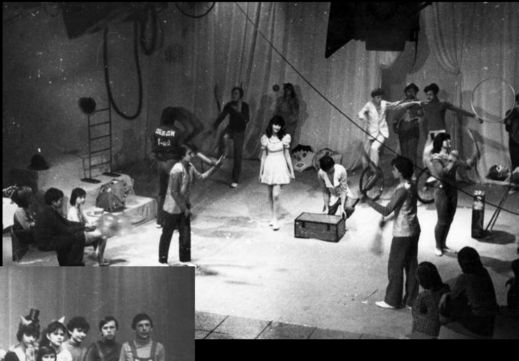
Студія циркового та естрадного мистецтва "Арлекін". Львів, 1976–1984 рр.