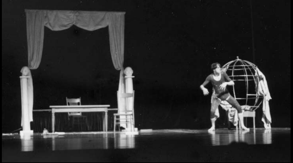
Сцени з вистави "Попті і Хуаххо" Дугласа. Автор вистави – А. Гугнин. Театр пантоміми "Мімограф", 1992 р.