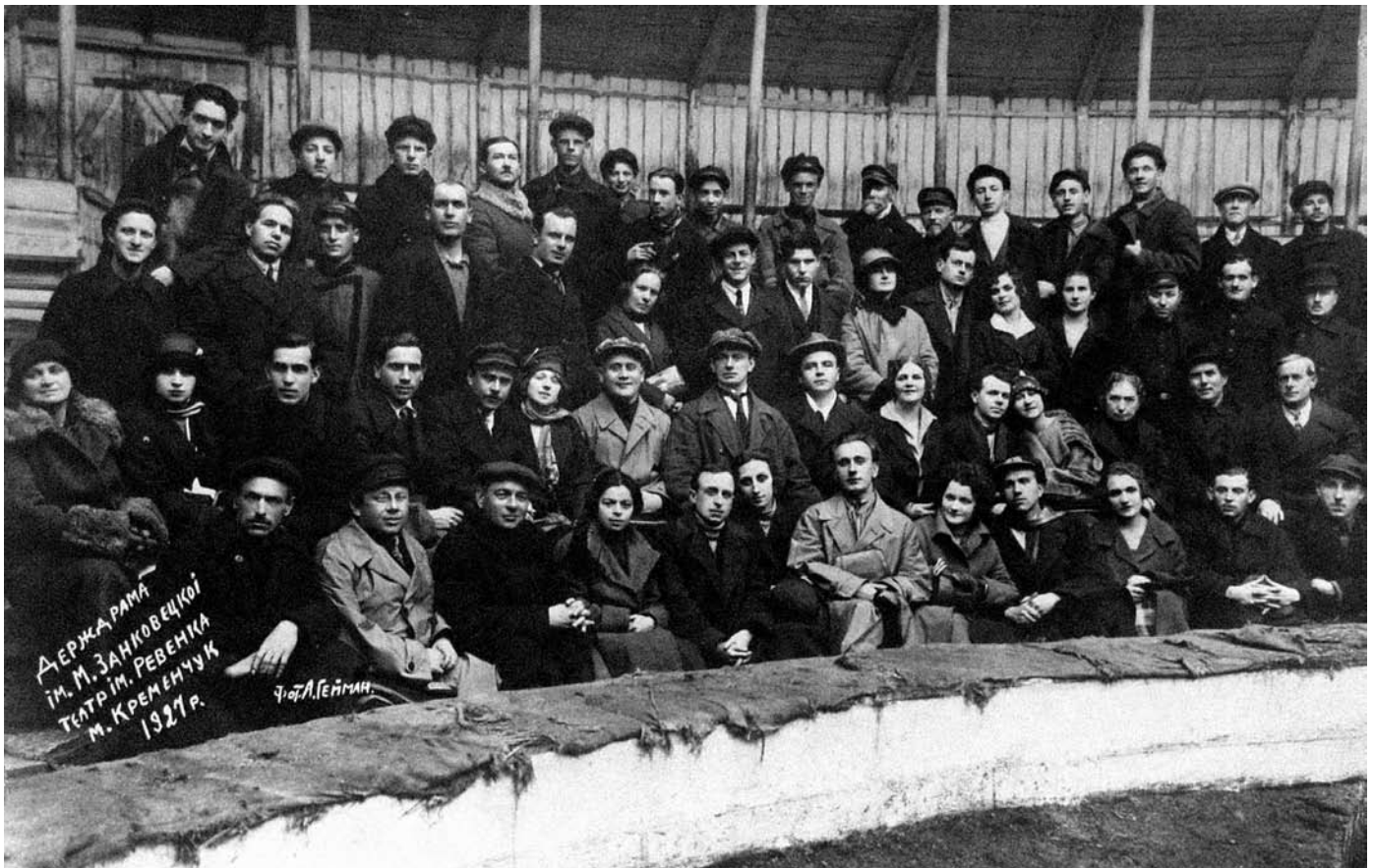
Колектив Державного українського драматичного театру ім. Марії Заньковецької, 1927 р.

сито радянської цензури є тим спільним знаменником, який об'єднує їх усі. Згодом, уже в часи Незалежності, з'явилося багато буклетів, альбомів з історії театру.