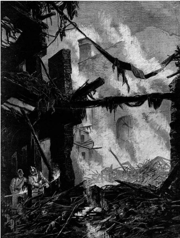
Згарище Рінгтеатру. Гравюра з віденської “Нової ілюстрованої газети”, число 12 за 1882 р.

й до Львова – столичного міста Галичини і Володимирії. Зокрема, на адресу редакції польського щоденного часопису “Gazeta Lwowska” перша телеграма з повідомленням про пожежу була відправлена її віденським кореспондентом 8 грудня вже о 20 год., а наступна, з уточненнями і подробицями – о 22.40. [1]. Відповідно число цієї за газети за 9 грудня донесло до львів’ян перші відомості про катастрофу у столиці наступного ж дня, а у випуску цієї ж газети за 10 грудня вже публікувалася доволі розлога і докладна стаття “Віденська катастрофа” [2]. Найвпливовіші галицько-українські часописи – народовське “Діло” і москвофільське “Слово” – опублікували перші стислі відомості про цю сумну подію у своїх суботніх числах за 10 грудня у газетній рубриці “Новинки”. Як українських, так і польських читачів часописів насамперед, зрозуміло, цікавила доля крайн-одноплемінників, що мешкали у Відні і могли бути серед театральної публіки того злочасного вечора. Редакціям українських видань оперативно надійшли телеграми