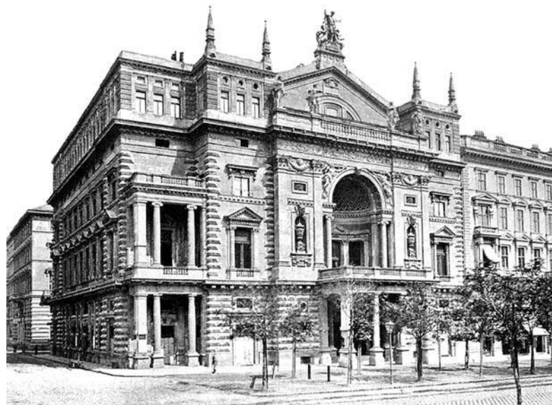
Вигляд Рінгтеатру до пожежі 1881 року.

Оскільки у другій половині XIX століття центральна частина Відня інтенсивно і щільно забудовувалася, а найпрестижніші розважальні заклади