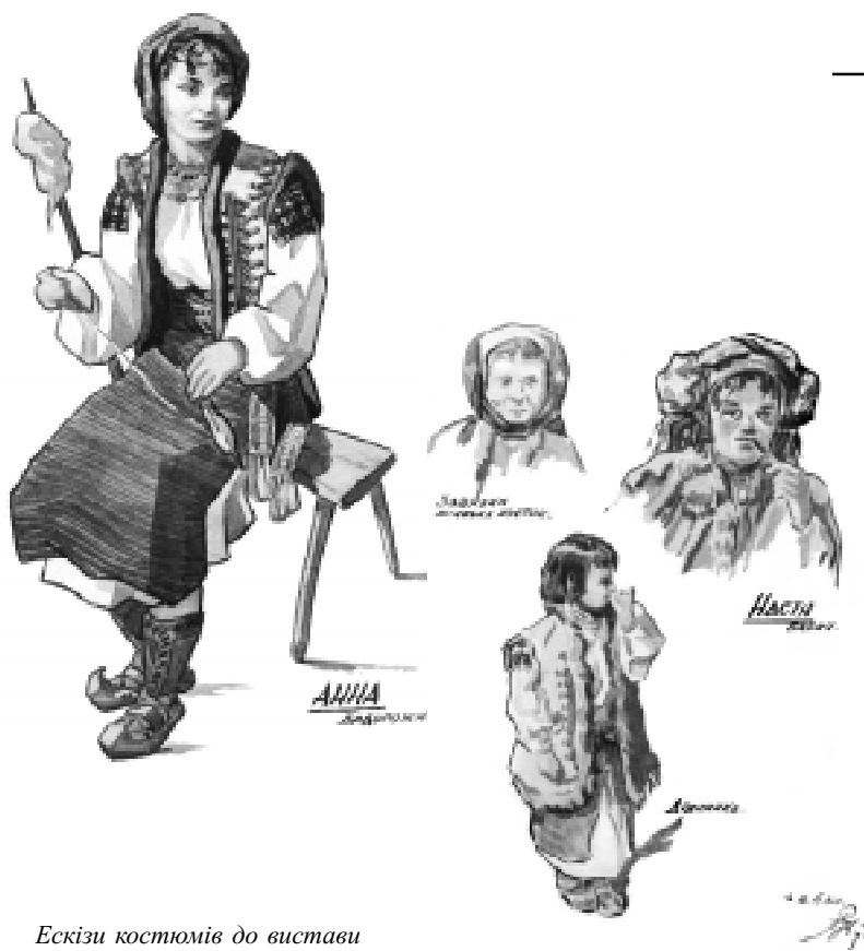
Ескізи костюмів до вистави "Украдене щастя", 1945 р.

любимець публіки, бо дійсно талановитий, творчий режисер і досконалий, цікавий актор у численних ролях, а головню у народних" [26].