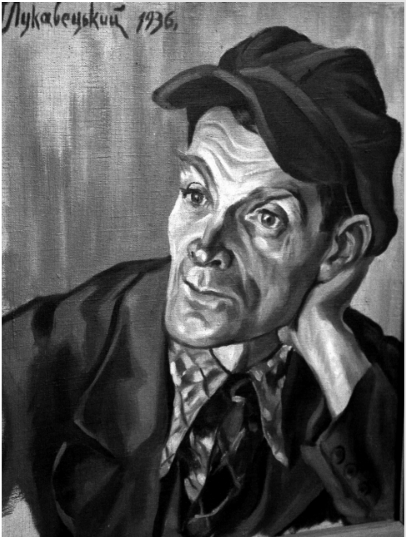
Портрет Олекси Скалозуба, 1936 р. полотно, олія (56x45), Коломийський музей народного мистецтва Гуцульщини та Покуття ім. В. Кобринського