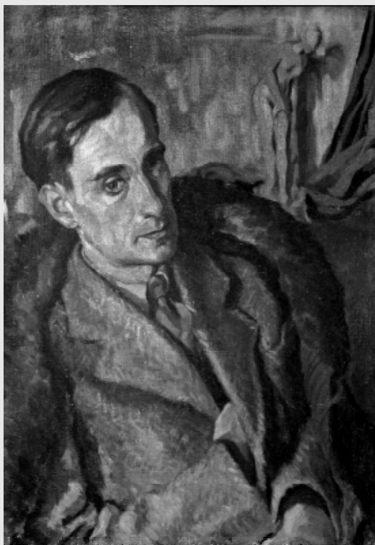
Портрет Володимира Блавацького 1936 р., полотно, олія (71x53), Музей історії міста Коломия.