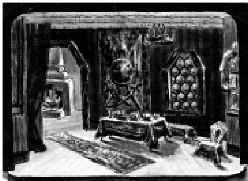
Ескіз декорації до вистави "Назар Стодоля" Т. Шевченка, 1955 р.