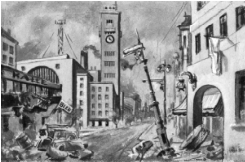
Ескіз декорації до вистави "Перший день свободи" Л. Кручковського, 1960 р.