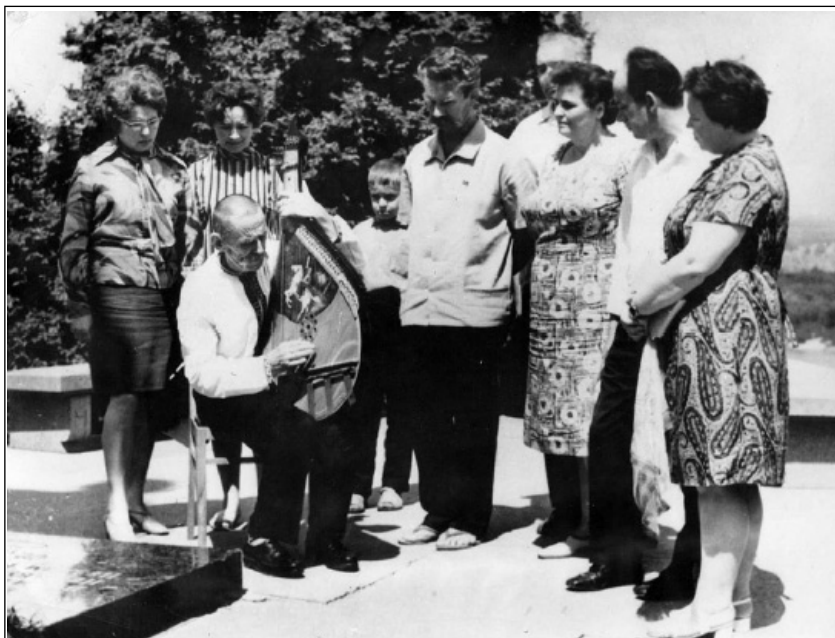
Кобзар Євген Адамцевич серед своїх слухачів на Тарасовій горі у Каневі (1971)