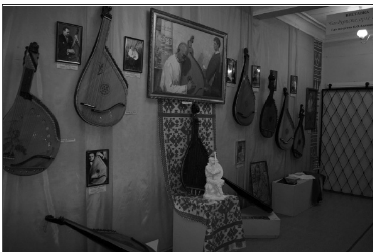
Експозиція виставки “Бандуристе, орле сизий”, присвяченої 110-й річниці від дня народження Євгена Адамцевича