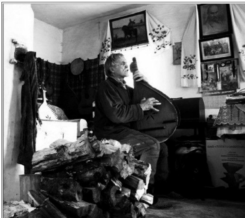
Кобзар Ігор Рачок (1937)