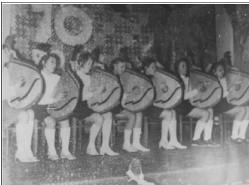
Фотографія 4. Ансамбль бандуристів Лубенської дитячої музичної школи на ювілейному вечорі в Солоницькому сільському клубі.