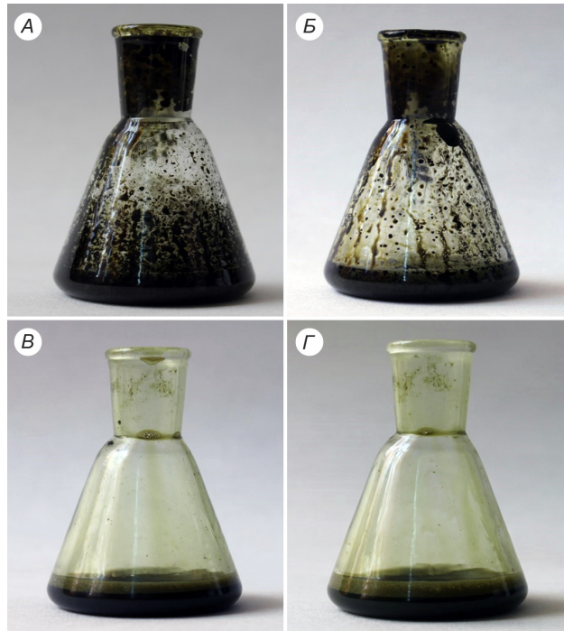
Рис. 1. Водна емульсія БФ ЕКЛ та її стабілізовані біокомплексом PS форми. Концентрація біокомплексу PS (г/л): А – 0 (контроль); Б – 0,6 г/л; В – 2,0 г/л; Г – 3,3 г/л