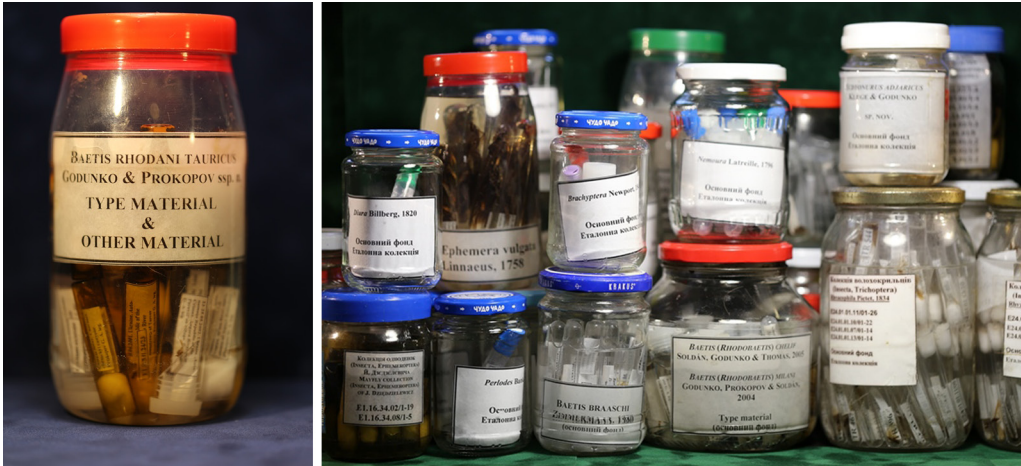
Рис. 2. Спосіб фіксації та обладнання для тривалого зберігання еталоної колекції амфібіотичних комах України у Державному природознавчому музеї НАН України (Львів). Ліворуч – матеріальна банка з пробірками, що містять типовий матеріал кримського ендеміка Baetis rhodani tauricus . Праворуч – матеріальні банки з матеріалом еталоної колекції

металевими або пластиковими кришками. Залежно від об'єму та форми матеріальної банки, пробірки у ній розміщують в один або кілька рядів. У разі розміщення пробірок корками вгору об'єм матеріальної банки заливають так, щоби повністю покрити їх фіксатором (мінімальна висота шару фіксатора над пробірками повинна становити 2 см). У разі розміщення пробірок корками донизу фіксатором заповнюють об'єм матеріальної банки, що відповідає 2/3 довжини пробірок останнього ряду. Зверху на пробірки кладуть шар вати. За використання ватних прокладок, які захищають пробірки від ушкоджень, витрати спирту зростають унаслідок всмоктування фіксатора. Оскільки щільність прокладок, порівняно з ватними корками, значно менша, додаткові витрати фіксатора становлять 10–15 % від загального об'єму матеріальної банки. Окрім того, що кожна пробірка повинна містити географічну і таксономічну етикетки (з інформацією про дату і місце збору матеріалу (по можливості коротку характеристику біотопу та гідрологічних показників), прізвище колектора, таксономічну належність матеріалу, прізвище автора визначення матеріалу), до матеріалів, що зберігаються в музейних колекціях, додають відповідні етикетки із зазначенням інвентарних номерів. Етикетки бажано виготовляти з цупкого білого паперу або кальки, друкуючи їх на лазерному принтері.