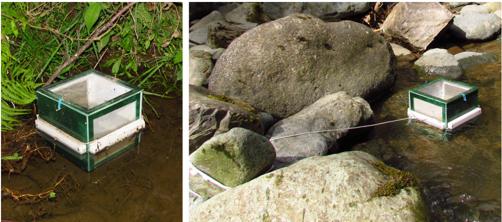
Рис. 1. Конструкція садка для виведення дорослих особин амфібіотичних комах. Ліворуч – зовнішній вигляд садка, збільшено. Праворуч – спосіб кріплення садка в терені

Оскільки у систематиці амфібіотичних комах однаково використовуються комплекси ознак личинок та імаго, особливу наукову цінність становлять дорослі особини, що були виведені з личинок, зі збереженням личинкової та субімагінальної (для одноденок) шкірки. Тільки такі екземпляри найпридатніші для комплексних описів нових таксонів. Для виведення відбирають личинок останнього віку, готових до линьки на субімаго або імаго (у одноденок і веснянок вони мають темні крилові зачатки), і до перетворення на дорослу особину утримують у вивідних садках (не варто вміщувати в садки личинки різних видів). Конструкція садків різноманітна і детально описана у праці [5] (рис. 1). В окремих випадках (наприклад, потамофільні або озерні види) годівлю личинок здійснюють в акваріумах із постійною