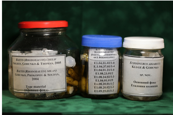
Fig. 3. Examples of type material (type series of species) marking and storing in the model collection of aquatic insects of State Museum of Natural History NAS of Ukraine. Imagoes and larvae of mayflies (Ephemeroptera) in ethanol