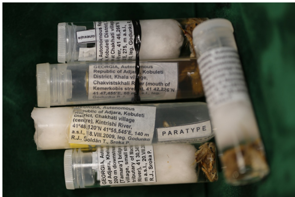
Fig. 5. Examples of type material (type series of species) marking and storing in the model collection of aquatic insects of State Museum of Natural History NAS of Ukraine. Imagoes and larvae of mayflies (Ephemeroptera) in ethanol