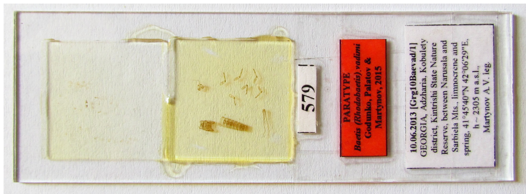
Рис. 4. Приклади маркування та зберігання типового матеріалу (типів серії видів) у еталонній колекції амфібіотичних комах. Колекція мікропрепаратів личинок одноденок (Ephemeroptera)