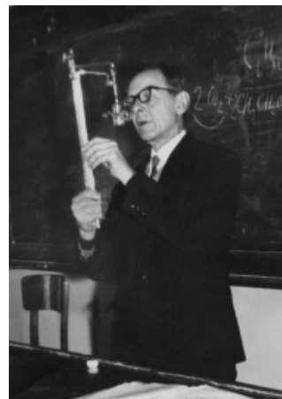
Сергій Орестович Гребінський (1905–1987) читає лекцію

Свої наукові інтереси проф. С.О.Гребінський спрямовував і на радіобіологію рослин. Реалізація цього напрямку досліджень стала можливою зі створенням у 1957 р. на біологічному факультеті проблемної лабораторії радіаційної та фізико-хімічної біології. Показано стимулювання росту ряду культурних рослин низькими дозами рентгенівського та \gamma -випромінювання. Розроблений оригінальний спосіб опромінення пророслого насіння рентгенівськими променями, що забезпечувало