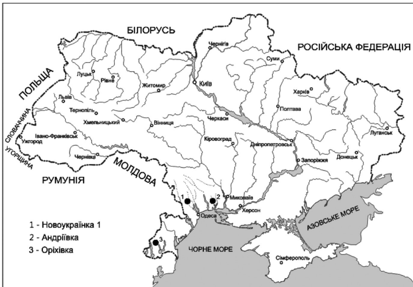
Рис. 1. Місцезнаходження решток костистих риб пізнього меотису Північного Причорномор'я

Місцезнаходження Новоукраїнка 1 ( 46^{\circ}48' пн.ш., 30^{\circ}17' сх.д.) відкрите у 1958 р. західніше однойменного села Болградського району Одеської області (рис. 1). Воно локалізоване на прорізаному ярмом правому схилі долини невеликої пересихаючої річки, яка впадає у Хаджибейський лиман [8]. У складі місцезнаходження представлені два ориктоценози, приурочені до різновікових горизонтів меотичної товщі [18]. Більш давній (Новоукраїнка 2), складений рештками крупних ссавців гіпаріонової фауни у зеленуватих суглинках із прошарками вуглистих включень і щільної пластинчастої зелено-сірої глини загальною потужністю до 1,5 м, датується раннім меотисом (MN 12). Це захоронення річкового типу має прибережно-континентальне походження [9]. Ориктоценоз утворився у результаті зносу і подальшого транспортування решток тварин водним потоком на невелику відстань. Кістки розміщені нерівномірно, вкриті залізистою кіркою, необкатані, не мають слідів погрозів хижаками [7, 8]. Гіпсометрично вище, безпосередньо під понтичними вапняками, залягає товща пісків і гравелітів алювіального походження з численними рештками дрібних ссавців і прісноводних риб, датована термінальною фазою меотису – Новоукраїнка 1 [18].