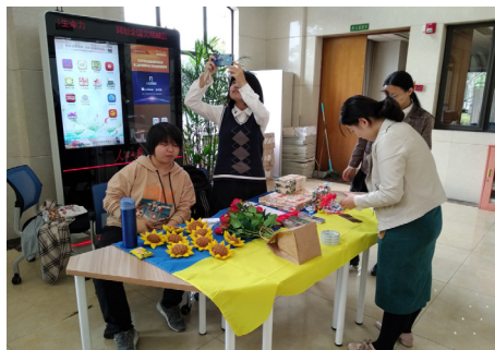
Іл. 20. Студенти-україністи готують українську експозицію для загальноуніверситетського заходу презентації спеціальностей. ШУІМ. м. Шанхай, 7.11.2019 р.