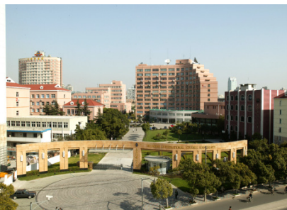
Іл. 05. Кампус ШУІМ у районі Хункоу, м. Шанхай. 2012 р.