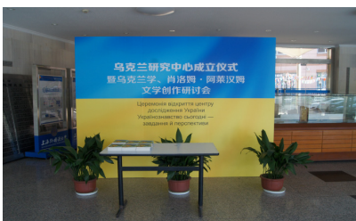
Іл. 11. Церемонія відкриття Центру дослідження України в ШУІМ, м. Шанхай. 2015 р.