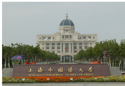
Іл. 06. Кампус ШУІМ у районі Сунцзян, м. Шанхай. Вересень 2001 року.