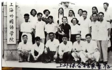
Іл. 04. Шанхайський інститут іноземних мов. м. Шанхай. 1956 р.