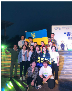
Іл. 19. Студенти-україністи – учасники пісенного свята з українським прапором. ШУІМ. м. Шанхай. 16.05.2019 р.