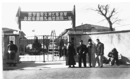
Іл. 02. Шанхайський коледж іноземних мов при Східнокитайському університеті народної революції. м. Шанхай. 1950 р.