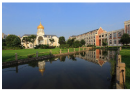
Іл. 08. Корпус Інституту Росії та Євразії ШУІМ (зліва) у кампусі Сунцзян, м. Шанхай. 2011 р.