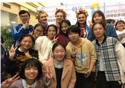
Іл. 21. Студенти-україністи разом з українськими студентками на університетському святі презентації спеціальностей. ШУІМ. м. Шанхай, 7.11.2019 р.