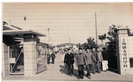
Іл. 03. Шанхайський коледж російської мови при Східнокитайському університеті народної революції. м. Шанхай. Вересень 1954 року.