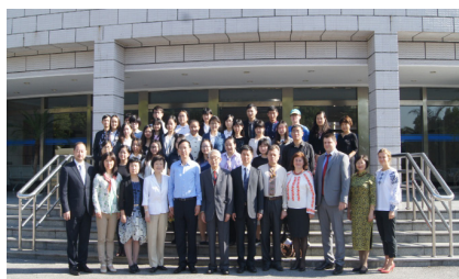
Іл. 12. Учасники відкриття Центру дослідження України в ШУІМ та українознавчої конференції, м. Шанхай. 2015 р.