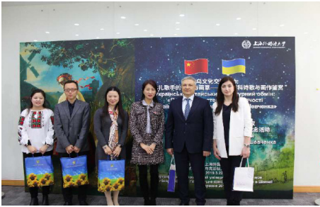
Іл. 25. Генеральне консульство України в Шанхай дарує українську літературу для україністики ШУІМ. м. Шанхай, 22.03.2109 р.