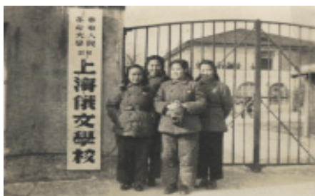
Іл. 01. Шанхайська школа російської мови при Східнокитайському університеті народної революції. м. Шанхай. 1949 р.