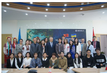
Іл. 24. Учасники відзначення 205-ї річниці від дня народження Тараса Шевченка. ШУІМ. м. Шанхай, 22.03.2019 р.