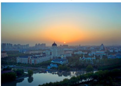
Іл. 07. Кампус ШУІМ у районі Сунцзян, м. Шанхай. 2012 р.