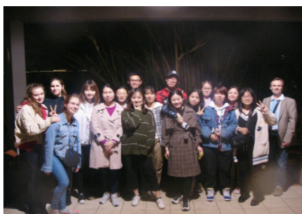
Іл. 23. Викладачі та студенти україністики – учасники Великоднього пікніка, організованого з ініціативи Асоціації українців Шанхая. м. Шанхай. 1.05.2019 р.