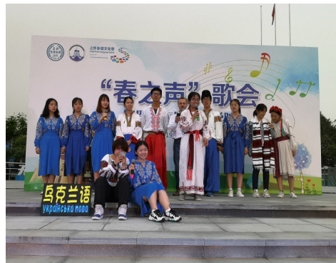
Іл. 18. Студенти-україністи виконують українську пісню на загальноуніверситетському пісенному святі. ШУІМ. м. Шанхай. 16.05.2019 р.