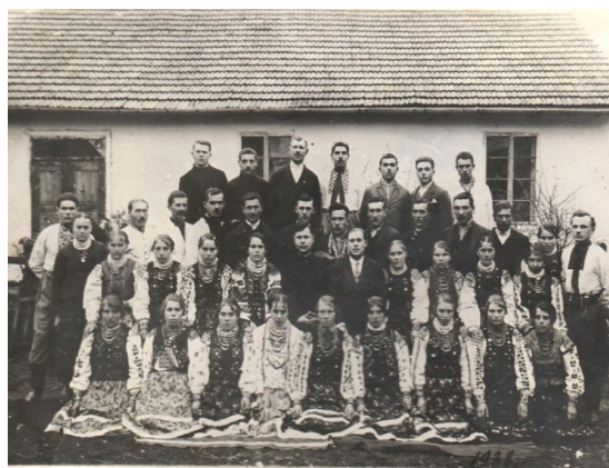
Хор с. Мужилівчч (1928)