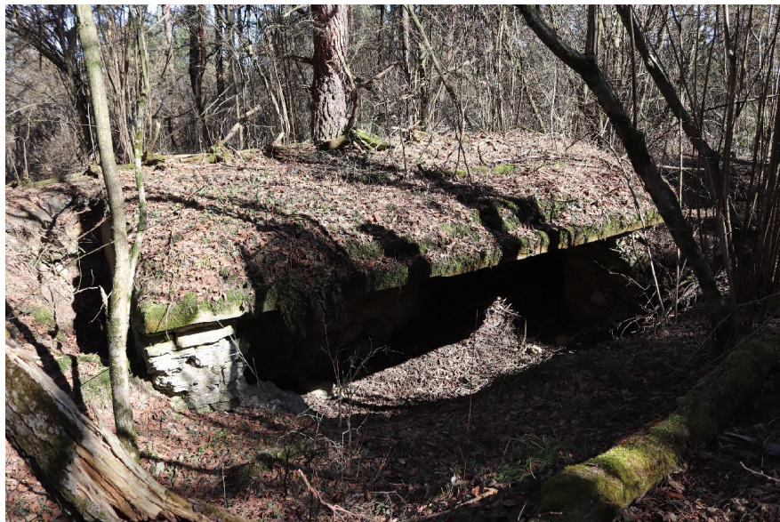
Залишки оборонних укріплень фортеці Миколаїв (сучасний стан)