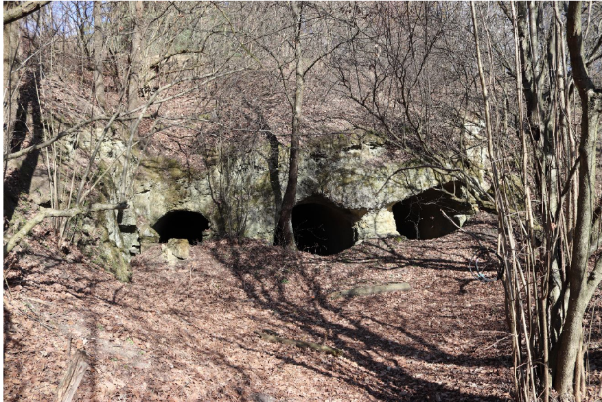
Артилерійські потерни під Лисою горою (сучасний стан)