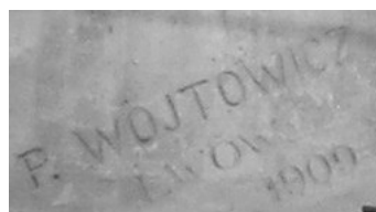
Підпис П. Войтовича на скульптурі “Мистецтво”

Нечастим і малопримітним атрибутом оздоблення львівських кам’яниць є підпис майстра на його роботі. Більшість зі збережених підписаних робіт було створено на початку ХХ ст.; у підписі переважно зазначено прізвище автора, часом ініціали або ім’я, рік і місто. У Львові можна побачити підписи скульпторів і художників Ю.Белтовського, Т.Блотницького, П.Войтовича, Б.М.Маковича, К.Пйотровича, С.Пліхаля, Я.Г.Розена та ін. Підпис митця спрощує встановлення авторства, датування роботи, дає змогу побачити розвиток протягом його творчого життя.