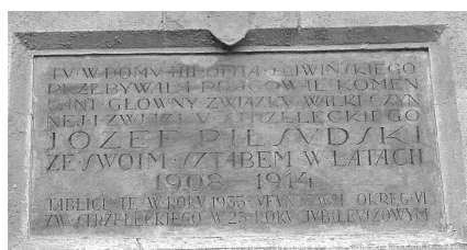
Польськомовна меморіальна будинкова таблиця про перебування Пілсудського зі штабом у Львові

У львівських храмах збереглися пам'ятні плити, скульптури і барельєфи відомих львів'ян, фундаторів, меценатів і благодійників, що їх замовляли родичі померлого або міська громада на знак великого трауру з метою увіковічнити пам'ять про небіжчика (зокрема, у церкві св. Євхаристії (пл. Музейна, 1) пам'ятні плити графині Дунін-Борковській, Марії Бартусівні, Тадеушу Жулінському, Артуру Гротгеру; в Латинській катедрі (пл. Катедральна, 1) – Катерині Яблонівській, архієпископу Більчевському, єпископу Керницькому та іншим; у церкві св. Андрія Первозванного (пл. Соборна, 3а) – Морнелові Уейському; у коствелі св. Марії-Магдалини (вул. С.Бандери, 10) – пам'ятна плита польському вченому Броніславу Людвіку Губриновичу; у Вірменській церкві (вул. Вірменська, 7–13) – директору Галицького музичного товариства Кароліо Мікулему, професору др. Юзефу Жулінському, у коствелі св. Антонія є пам'ятні плити Казимиру Мончинському та Йозефу Боровському тощо. Тексти пам'ятних плит за характером подібні до текстів меморіальних таблиць, інколи доповнених епітафічними елементами. Пам'ятні плити, виготовлені на згадку про шанованих громадян та жителів Львова, належним чином акцентувались у міському просторі завдяки розміщенню на сакральній території: всередині храму біля входу або у храмовому подвір'ї.