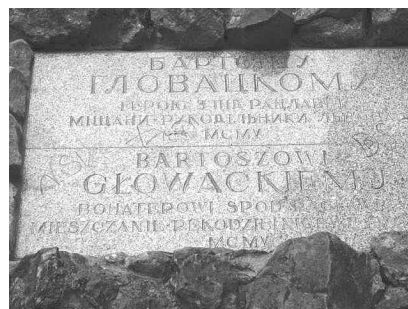
Двомовна таблиця на пам'ятнику Бартошу Гловацькому

Функцію пам'ятників певною мірою виконують пам'ятні знаки (наприклад, пам'ятний камінь на честь перемоги війська під командуванням короля Яна III Собеського над татарами на нижній терасі Високого замку; хрест у пам'ять про розстріляних гітлерівцями львівських професорів на горі біля вул. Сахарова), культурно-історичні меморіальні таблиці (Т.Костюшкові, Ф.Смольці, С.Гощинському, Я.Лему, З.Герберту, на честь проведення Гран-прі, приїзду до Львова Папи Римського Іоана Павла II тощо). Меморіальні дошки – порівняно дешевий засіб акцентування історії, який не потре-