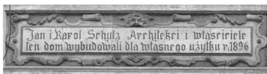
Будівельна таблиця на кам’яниці по вул. Б. Хмельницького, 65

Нечастим і малопримітним атрибутом оздоблення львівських кам’яниць є підпис майстра на його роботі. Більшість зі збережених підписаних робіт було створено на початку ХХ ст.; у підписі переважно зазначено прізвище автора, часом ініціали або ім’я, рік і місто. У Львові можна побачити підписи скульпторів і художників Ю.Белтовського, Т.Блотницького, П.Войтовича, Б.М.Маковича, К.Пйотровича, С.Пліхаля, Я.Г.Розена та ін. Підпис митця спрощує встановлення авторства, датування роботи, дає змогу побачити розвиток протягом його творчого життя.