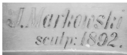
Підпис Й. Марковського на скульптурі “Фортуна”

Таким чином, написи історичного характеру роблять обличчя міста більш виразним: вони вербалізують події, увіковічують постаті, вписують споруди у певний часовий період розвитку міста, додають будинкам історичної та мистецької самобутності.