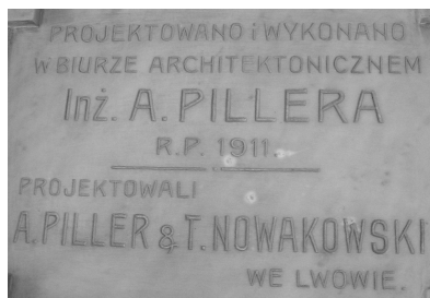
Будівельна таблиця в будинку по вул. Театральній, 8

Функцію “історичної пам’яті” міста певною мірою виконують також будівельні написи, які на спорудах сучасного Львова виконані переважно наприкінці ХІХ–на початку ХХ ст. Найчастіше будівельні написи фіксують інформацію про дату й обставини будівництва. У Львові більшість з них зроблено безпосередньо на фасаді будинку, рідше – на спеціальній вмонтованій дошці. Львівські будівельні написи різні за своїм наповненням. Інформативними є розлогі підписи, в яких може бути зазначено прізвище тогочасного президента міста, цісаря, архітектора, рік будівництва або реставрації. Проте у Львові будівельні підписи найчастіше є лаконічними – в них указано тільки рік побудови. Подеколи на будівлі зазначено кілька дат, наприклад у міру зведення її різних частин, або дата побудови і дата перебудови (костел св. Антонія, Латинська катедра). Очевидно, насамперед рекламну функцію виконують будівельні написи, в яких зазначено прізвище архітектора (наприклад, при вході у буд. 33 по вул. Рудницького на таблиці зазначено також адресу приймальні: “Budował w roku 1928 architekt Norbert Glatstein, Lwów, ul. Potockiego, 22”).