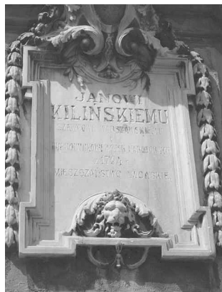
Польськомовна таблиця на пам'ятнику Янові Кілінському

В екстер'єрі Львова залишилося чотири пам'ятники, підписані польською мовою: революційним діячам Яну Кілінському (Стрийський парк), Войцеху Бартошу Гловацькому (Личаківський парк), Теофілу Вішньовському (і Юзефу Капусцінському) (Гицлева гора) та поету Адаму Міцкевичу (пл. Міцкевича), решту пам'ятників в часи радянської влади було знищено або перевезено до Польщі. Збереглися також пам'ятники в інтер'єрі (наприклад, бюст єврейського мецената Мауриція Лазаруса, встановлений між поверхами головного корпусу сучасного пологового будинку № 3 (вул. Рапопорта, 8).