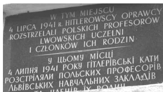
Двомовна меморіальна таблиця жертвам нацистів

бує спеціального місця та великих затрат. Найважливішим їх елементом, порівняно з пам'ятником, є текст.