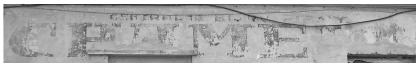
Стінопис “Centralne Biuro Firmy Chame(leon)”

Польськомовна епіграфіка закладів збереглась у сучасному Львові лише у вигляді старих вивісок-написів на будинках: наприклад, Skład towarów (вул. Наливайка, 11), Stacja benzynowa (Fo)rd (вул. І. Франка, 41), Centralne Biuro Firmy Chame(leon) (вул. Староєврейська, 48), Hotel Francuski (вул. Курбаса, 10) тощо. Великою рідкістю є збережена скляна вивіска з написом “Apteka pod Temidą Fryderyka Dewechego” (вул. Дорошенка, 36). Назви частини закладів свідчать про орієнтацію львівського підприємництва на міжнародні відносини. У них часто використовувалась іншомовна лексика, яка презентувала міжнародну марку або стандарт.