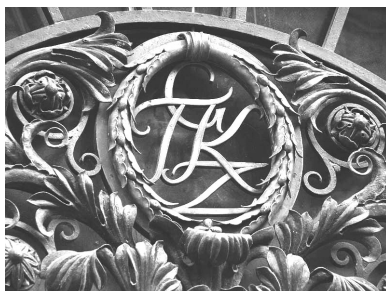
Аббревіатура “GTKZ” Галицького земського кредитного товариства

В оздобленні львівських будинків доволі часто присутні ініціали та аббревіатури на позначення власників будинку або установи, яка там розташована: наприклад, “Galicyskie Towarzystwo Kredytowe Ziemskie” (існувало протягом 1841–1939 рр.) (вул. Коперніка, 4), “Galicyskie towarzystwo muzyczne” (вул. Чайковського, 7; аббревіатура на будинку та меблях, які зараз зберігаються в Етнографічному музеї), “Bank Związku Spółek Zarobkowych” (1929–1938 рр.) (пл. Галицька, 7) тощо. Їх зображення доволі часто створює графічну загадку: літери деформовані таким чином, що їх прочитання стає розгадуванням ребуса: часто вживаються такі прийоми, як світло-тіньове рішення, тривимірність, компонування літер з частковим накладенням, з’єднанням, доторканням елементів знаку. Аббревіатури та ініціали в міській архітектурі певною мірою замінили родинні герби та фірмові логотипи.