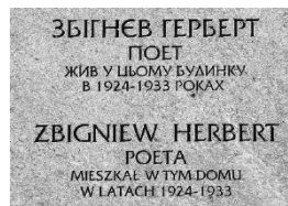
Двомовна меморіальна таблиця З. Герберту