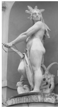
Скульптура з підписом “Америка”

“Asja”, “Ameryka” й “Afryka”, вони вказують на туристичне спрямування закладу та символізують його відкритість для цілого світу. Барельєфи-алегорії “Praca”, “Oszczędność” – з одного боку та “Rolnictwo”, “Górnictwo”, “Przemysł”, “Technika”, “Handel” з другого на будинку сучасного Промінвестбанку (вул. Листопадового Чину, 8), колишньої філії Австро-Угорського банку (1912–1913) – містять інформацію про галузі, в які підприємці вкладали гроші, і про те, що необхідно для досягнення економічної свободи.