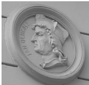
Барельєф з підписом “Ян Длугош”

Польськомовна епіграфіка закладів збереглась у сучасному Львові лише у вигляді старих вивісок-написів на будинках: наприклад, Skład towarów (вул. Наливайка, 11), Stacja benzynowa (Fo)rd (вул. І. Франка, 41), Centralne Biuro Firmy Chame(leon) (вул. Староєврейська, 48), Hotel Francuski (вул. Курбаса, 10) тощо. Великою рідкістю є збережена скляна вивіска з написом “Apteka pod Temidą Fryderyka Dewechego” (вул. Дорошенка, 36). Назви частини закладів свідчать про орієнтацію львівського підприємництва на міжнародні відносини. У них часто використовувалась іншомовна лексика, яка презентувала міжнародну марку або стандарт.