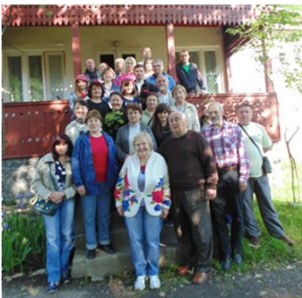
Учасники XXXV сесії Палеонтологічного товариства НАН України «Еволюція органічного світу та етапи геологічного розвитку Землі» (сміт Чинадійово, 21 травня 2014 р.)