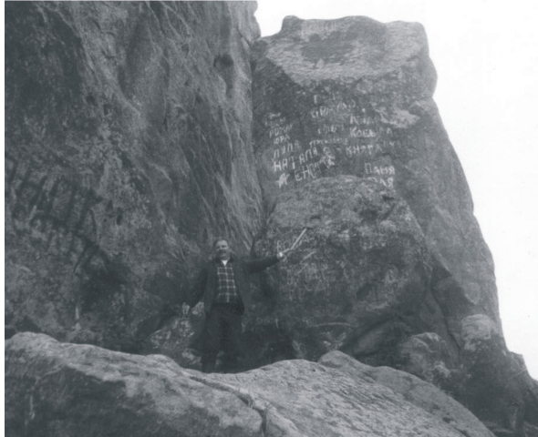
Рис. 1. Масивні ямненські пісковики з піщаною конкрецією.

периферії. В будові конкрецій добре виділена внутрішня частина яскраво-жовтого кольору, крихка, унаслідок механічної дії легко руйнується. В напрямі до периферії її міцність збільшується, спектр кольору змінюється від жовтого до коричневого.