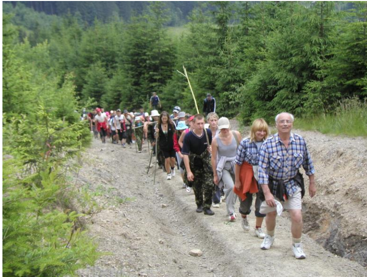
Під час сходження на Говерлу, липень 2006 р.

найактивніша науково-дослідна діяльність, яка вилилась у написанні численних звітів, статей, кандидатської і докторської дисертацій.