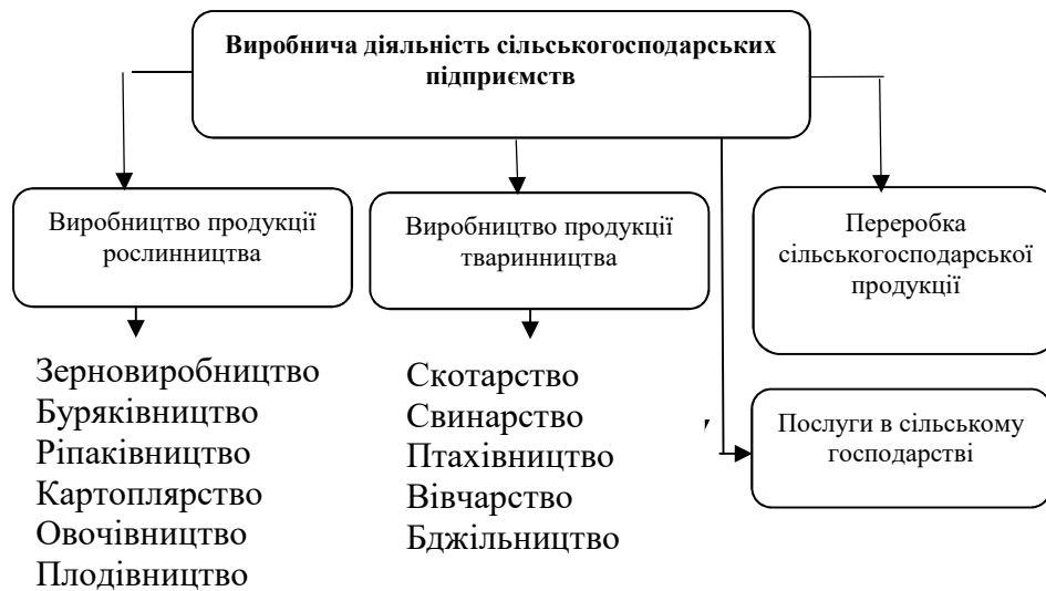
Рис. 2. Структура виробничої діяльності сільськогосподарських підприємств

Окрім того, сільськогосподарські підприємства можуть здійснювати первинну переробку сільськогосподарської продукції або надавати послуги сільськогосподарського характеру стороннім особам. Як зазначають Н.С. Данкевич та О.В. Михайленко, основним принципом здійснення виробничої діяльності сільськогосподарських підприємств є вільний вибір напрямів діяльності [6, с. 896].