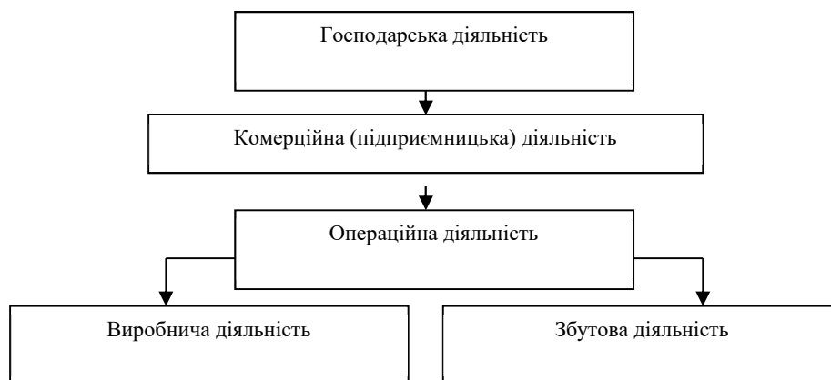
Рис. 1. Види діяльності суб'єктів господарювання

Отже, виходячи із поданого вище, можна зробити висновок, що виробнича діяльність підприємства це діяльність пов'язана із виробництвом продукції, яка включає в себе всі стадії технологічного процесу. При тому, виробнича діяльність тісно переплетена із збутовою діяльністю, оскільки реалізація продукції є кінцевим етапом обороту вкладених ресурсів, а результати реалізації безпосередньо впливають на ефективність виробничої діяльності.