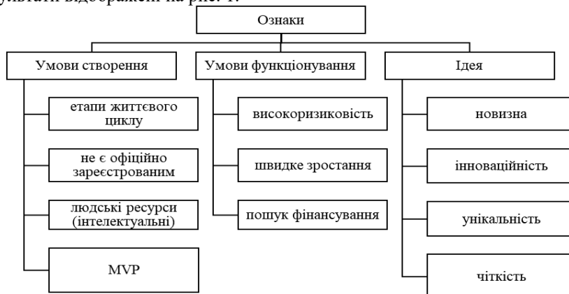
Рис. 1. Ознаки стартапів як спеціального типу підприємництва

інноваційність, інтелектуальну складову активів, можливості стрімкого зростання та ін. Результати відображені на рис. 1.