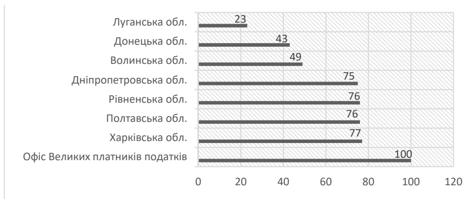
Рис. 3. Регіони України з найбільшою і найменшою часткою користувачів податкових е-сервісів протягом 2020 року, %