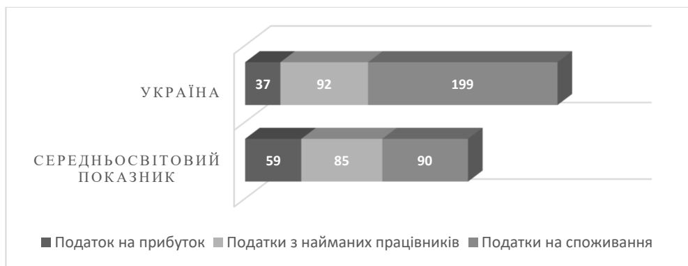
Рис. 1. Час на адміністрування податкових платежів в Україні та світі у 2020 р. (год.)

Згідно даних міжнародного рейтингового оцінювання «Сплата податків 2020» («Paying taxes 2020») [5], який щорічно розробляє аудиторська компанія PricewaterhouseCoopers разом з групою Світового банку, в Україні платники податків витрачають 328 годин на адміністрування податкових платежів, що на 40 % більше порівняно зі середньосвітовим показником (рис. 1).