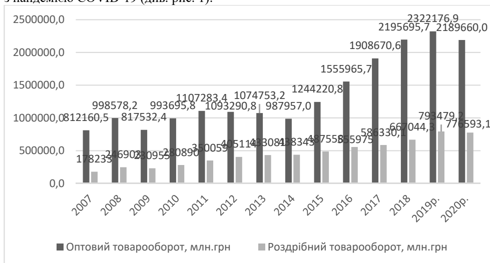
Рис. 1. Динаміка товарообороту в Україні за 2007-2020 рр., млн. грн. [складено за даними: 7 та 10, С. 21].

Виклад основного матеріалу дослідження. Стан торговельної діяльності в Україні найкраще досліджувати через абсолютні значення і тенденції зміни ключових показників, найінформативнішим серед яких залишається товарооборот. Аналіз його динаміки демонструє загальну позитивну тенденцію на зростання торговельної активності на вітчизняному ринку. А також доводить вплив на показники внутрішнього товарообороту негативних зовнішніх чинників, як то світова фінансово-економічна криза 2008-2009 рр [3, С. 69], початок війни з Росією в 2014 році чи то падіння ділової активності після введення жорстких карантинних обмежень у зв'язку з пандемією COVID-19 (див. рис. 1):