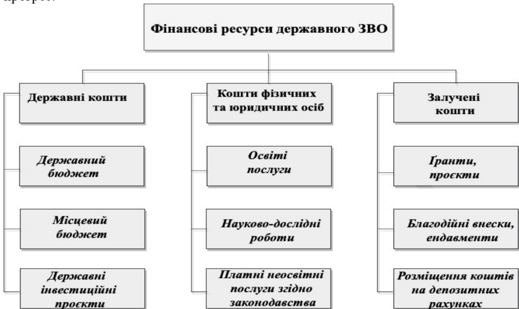
Рис. 2. Фінансові ресурси державних ЗВО України

У своїй науковій праці М. Тарасюк, М. Кладченко характеризують фінансові ресурси як фонди грошових коштів, що формуються державою, суб'єктами господарювання і домогосподарствами, знаходяться у їхньому розпорядженні та є джерелом їхнього розвитку [11]. В умовах становлення ринкових відносин в Україні та реформування її економічної системи обсяг фінансових ресурсів, спосіб організації їх залучення, розподілу та використання мають як кількісний, так і якісний вплив на фінансове забезпечення та, як наслідок, визначають суспільний прогрес.