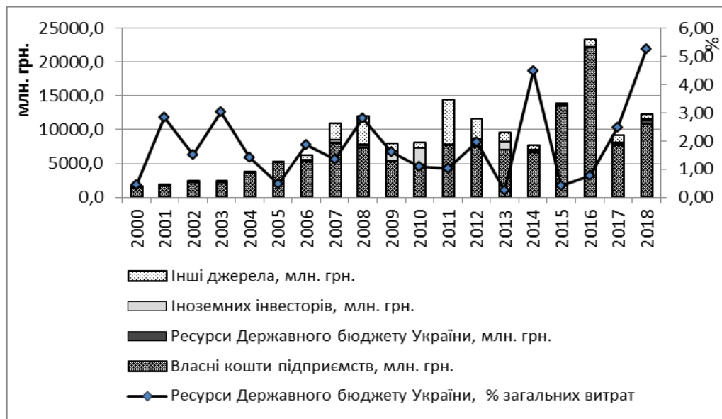
Рис. 2. Показники джерел фінансування інноваційної діяльності промислових підприємств України у 2000-2018 роках

сприятиме стабілізації та удосконаленню підходів до стимулювання інноваційного розвитку.