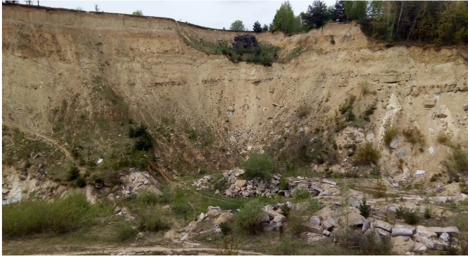
Рис. 7. Уступ розкривної товщі і давній робочий уступ Винничківського кар'єру Fig. 7. Overburden bench and inoperative mine wall of Vynnychky quarry

Днище кар'єру складається з двох частково відокремлених частин: північної і південної. На сході межа між ними непомітна. Межі днища (підніжжя робочого уступу) переважно чіткі, іноді ускладнені насипними формами. Лише на сході північної частини кар'єру антропогенна поверхня взагалі без уступу переходить у природний схил, що пояснюємо схиловим рельєфним розміщенням Винничківського кар'єру. Південна частина днища (максимальна довжина – понад 270 м, ширина – близько 150 м) практично з усіх сторін оточена схилами (рис. 8). Усі частини днища ускладнені поодинокими або суцільними (наприклад, у північно-східній частині кар'єру) насипами. Останнє розширення днища відбулось упродовж 2019–2020 рр. у південній частині кар'єру.