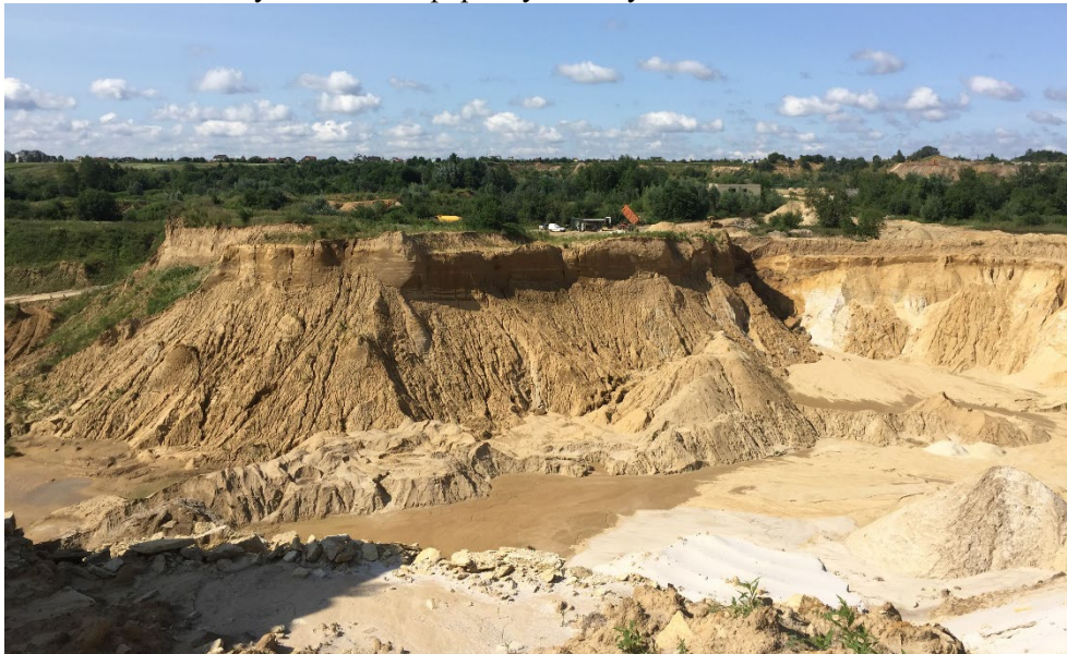
Рис. 5. Загальний вигляд на південну частину кар'єру Давидів-3 Fig. 5. General view of the southern part of the Davydiv-3 quarry

Винничківський піщаний кар'єр має понад 50-літню історію. На топографічній карті 1984 року глибина кар'єру позначено у 30 м. До 2009 року видобуток здійснювали у північній частині кар'єру, яка загалом є найдавнішою. З 2009 року розробка кар'єру здійснювалася у південному напрямі. У наступні 2010-2011 рр. у південній частині утворилася велика виїмка з бермами, невисокими уступами і незначними внутрішніми відвалами. Північніше сформувалися потужні плоскі відвали. З 2012 р. розробку кар'єру знову повернули у північну частину. Утворилася висока (до 30 м) стінка, яка знижується у західному і південному напрямках. Починаючи з 2015 р. кар'єр практично перестав працювати. Виняток становить незначне просування розкривного уступу на півдні кар'єру (2019 р.) з формуванням нової берми, зміни поверхні існуючої берми у південно-західній частині, утворення денудаційно-аккумулятивної поверхні між північною і південною частинами кар'єру. Наймолодша (2020 р.) антропогенна форма кар'єру – плоский насип дугоподібної форми у плані у його північній частині.