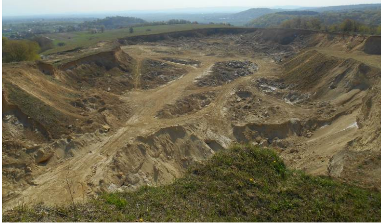
Рис. 8. Південна частина Винничківського кар'єру, оточена чітко виразними уступами, зліва на задньому плані – антропогенний останець Fig. 8. Southern part of Vynnychky quarry, surrounded by clearly defined ledges, at the background on the left is anthropogenic butte

сформований 2020 р. Він розташований у північній частині кар'єру на місці давніших відвалів і має довжину понад 120 м та ширину близько 80 м.