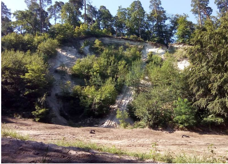
Рис. 2. Північна стінка і днище Винниківського піщаного кар'єру Fig. 2. Northern mine wall and mine floor of Vynnyky sandy quarry

на стінку кар'єру, утворюють денудаційно-аккумулятивні поверхні і схили. Висота відвалів сягає 3–7 м.