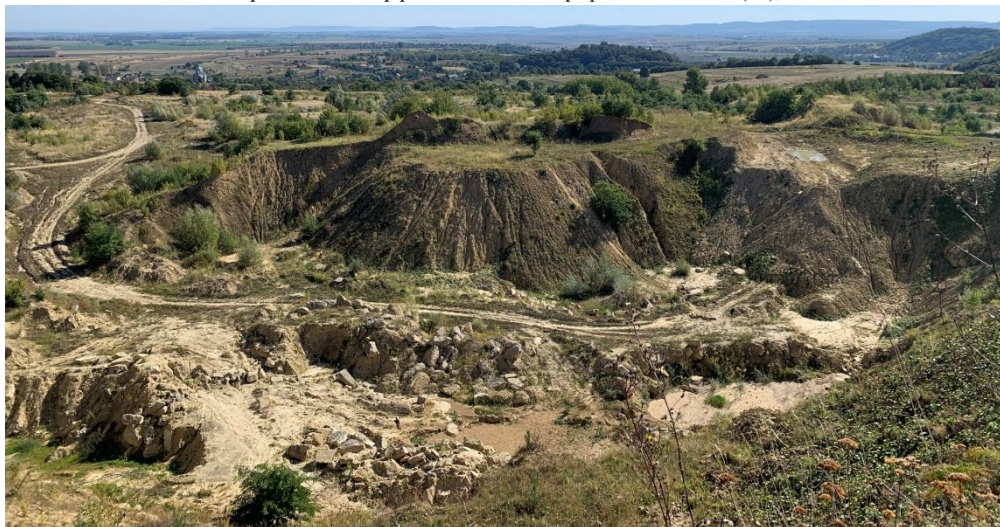
Рис. 9. Крупноуламкові відвали і плоский високий відвал, розчленований ерозійними формами