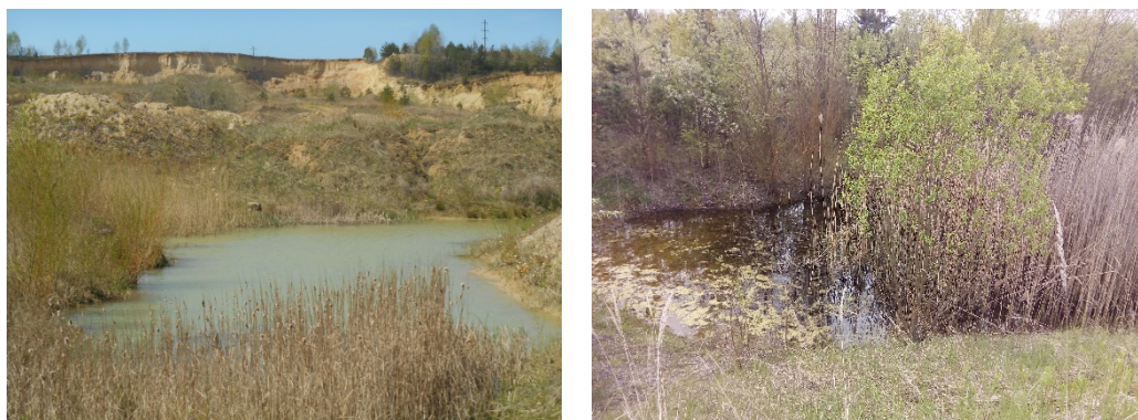
Рис. 10. Водойма між насипними формами (зліва – фото 2014 р., справа – 2023 р.)