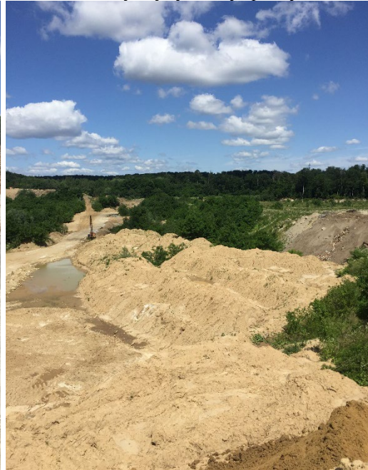
Рис. 4. Валоподібні і плоскі внутрішні відвали кар'єру Давидів-1 Fig. 4. Shaft-shaped and flat interior dumps of Davydiv-1 quarry

Кар'єр щонайменше 30 років безперервно експлуатують. За цей час його розвиток відбувався переважно у східному і південному напрямках. У процесі