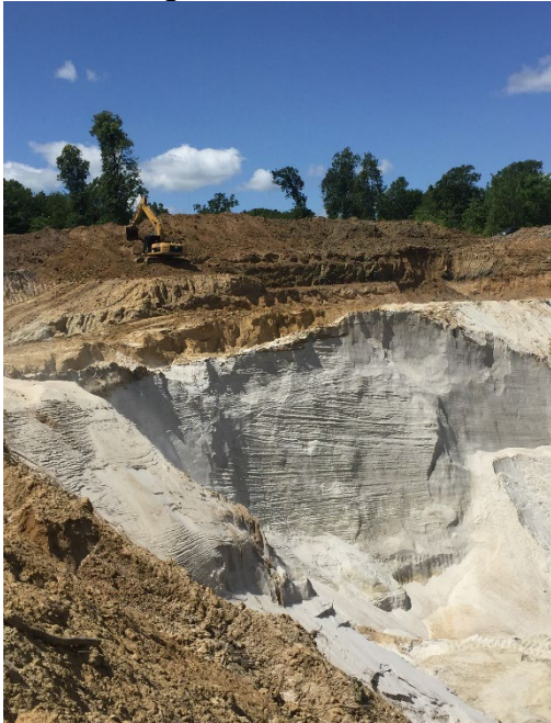
Рис. 3. Уступ розкривної товщі і робочий уступ кар'єру Давидів-1 Fig. 3. Overburden bench and mine wall of Davydiv-1 quarry