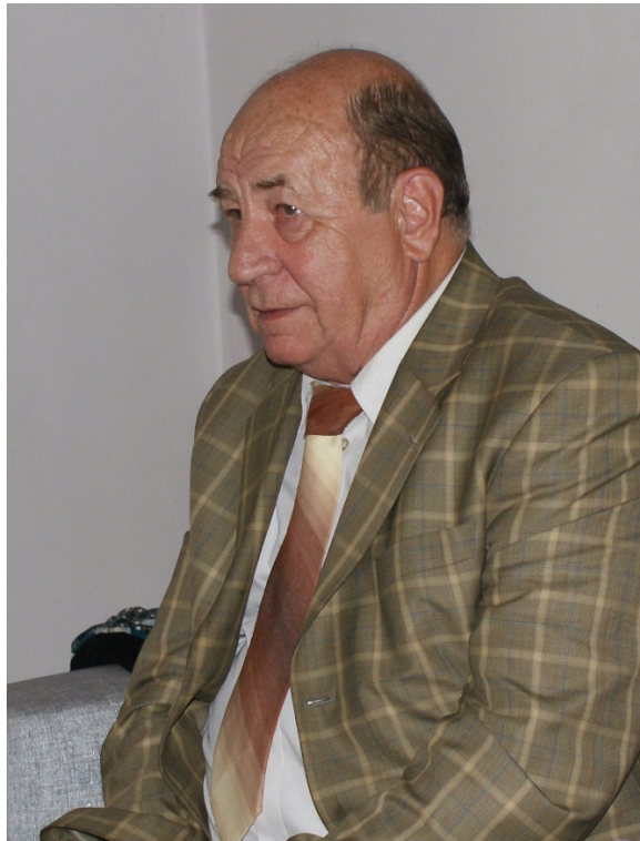
Рис. 1. Петро Феодосійович Гожик (1937–2020) Fig. 1. Petro Feodosiyovych Gozhik (1937–2020)

(1960 р.) вступив до аспірантури Інституту геологічних наук АН УРСР, з яким тісно пов'язав усе своє наукове життя: від аспіранта (1960–1963), молодшого наукового співробітника (1963–1974), старшого наукового співробітника відділу геотектоніки та геології антропогену (1974–1986), завідувача лабораторії геології і літодинаміки берегової зони (з 1982 р.), провідного наукового співробітника відділу геології антропогену (з 1986 р.), заступника директора з наукової роботи Інституту (1987–1997) до директора Інституту геологічних наук НАН України (1997–2020) (Пономаренко та ін., 2017).