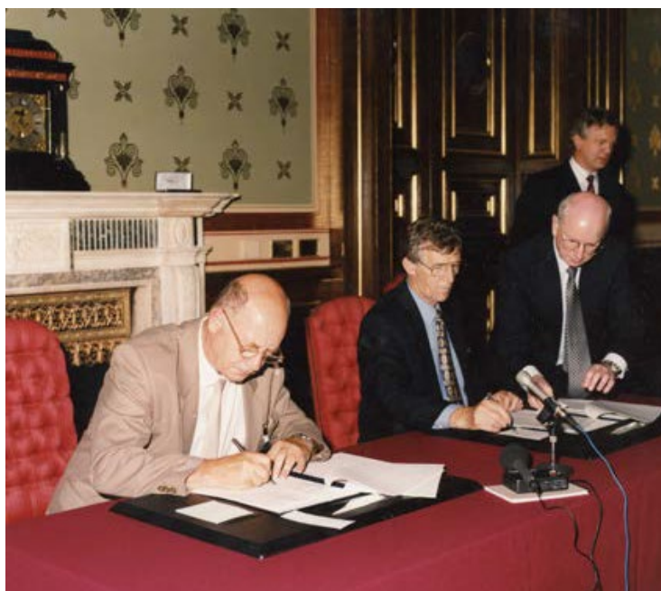
Рис. 3. Підписання Меморандуму про передачу Україні антарктичної станції “Фарадей”, 1995 р. (Академік..., 2018)