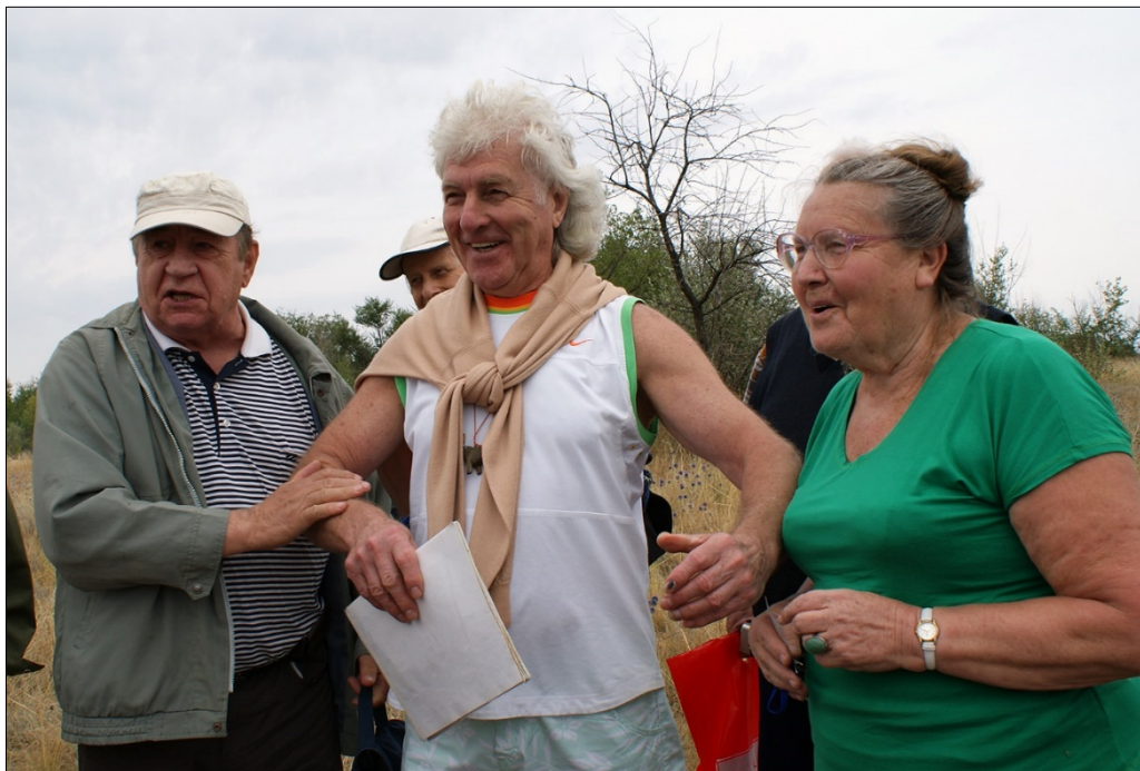
Рис. 7. Гарячі дискусії на розрізі Роксолани у Причорномор'ї під час українсько-польського семінару “Лесовий покрив Північного Причорномор'я”, 2013.

премії НАН України імені П. А. Тутковського (2008), нагороджений орденом “За заслуги” III та II ступеня (2008; 2012), Почесною грамотою Верховної Ради України, медаллю В. І. Лучицького “За заслуги в розвідці надр” (1998), Золотою медаллю Спільки геологів України та численними галузевими відзнаками (Пономаренко та ін., 2017).