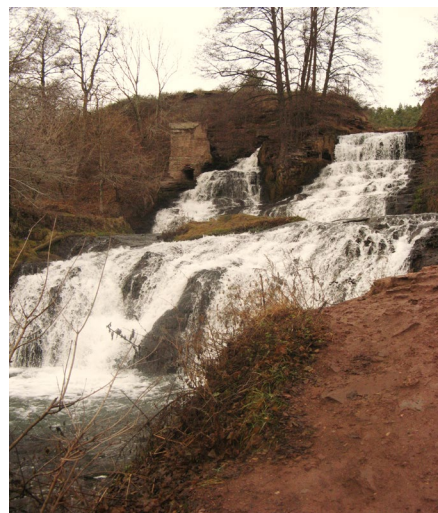
Рис. 3. Джуринський водопад (фото О. Бордун)