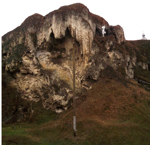
Рис. 2. Рукомишські скелі

Екскурсійний маршрут до с. Рукомиш і після нього можна доповнити історико-архітектурними, релігійними, оборонними спорудами та іншими екскурсійними об'єктами смт Микулинці, с. Дружба, с. Струсів, (до нього) та м. Бучач, с. Язлівець (після нього), а також заїздом на Русилівській та Джуринській водоспади і так аж до самого Дністерського каньйону (рис. 3).