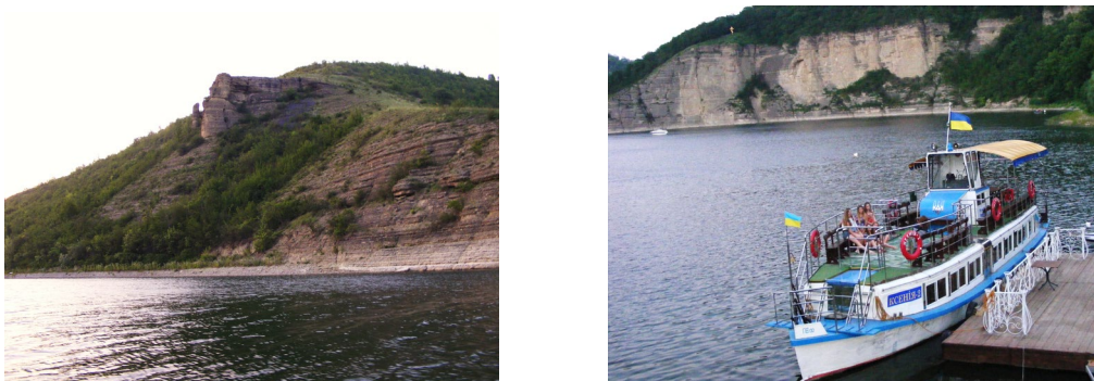
Рис. 5. Дністерський каньйон у с. Врублівцях Fig. 5. Dniester canyon in the village Wrubliwci

Іншим варіантом водного маршруту є сплав р. Дністер із с. Окопів вниз за течією до Бакотської затоки. Об'єктами показу із води буде Хотинський замок та геологічні відслонення у с. Устя, с. Велика Слобідка, с. Врублівцях, де розташована туристична база “Ксенія”, що володіє плавзасобами. На базі можна заночувати (рис. 5)