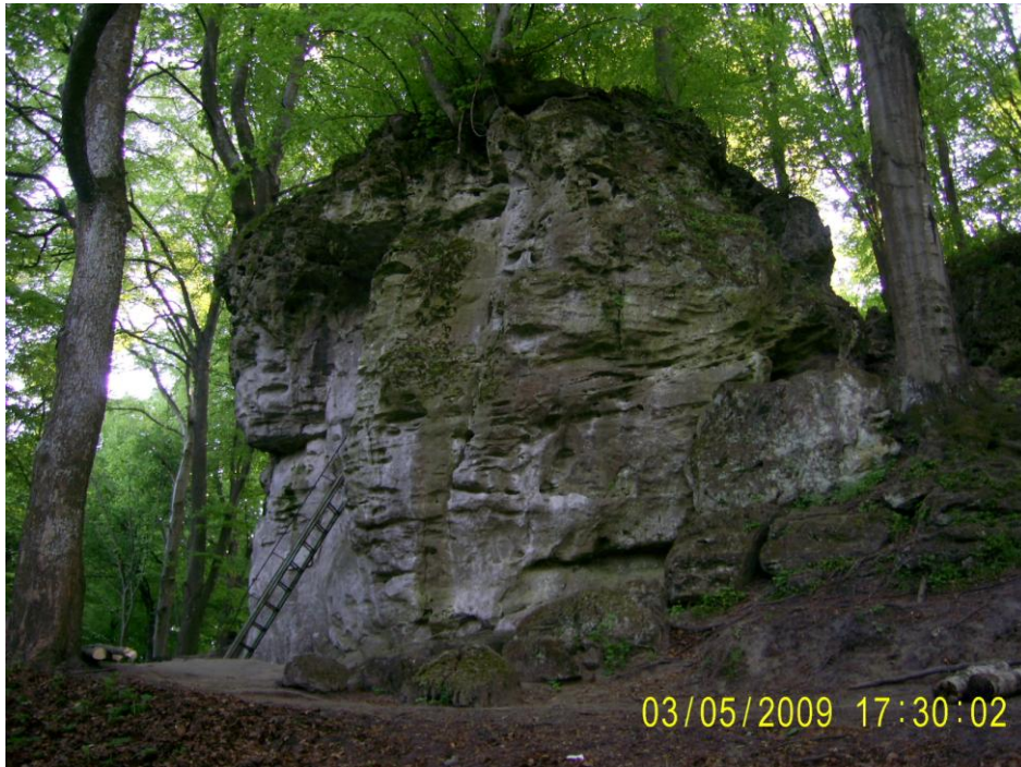
Рис. 3. Скелі на г. Кам'яна неподалік Крехівського монастиря, складені вапнистими пісковиками середнього бадену Fig. 3. Rock on the mountain Kamyaniv near Krekhiv Monastery, composed of limestone sandstones of the middle Baden

З геоморфологічних об'єктів (див. рис. 1) цікавими є: 2.1 – пасмо-останець Вовковиця (342 м), 2.2 – гора-останець Побійна південніше с. Крехів (див. рис. 2), скелі і печери (див. рис. 3) на горі Кам'яна (393 м) біля Крехівського монастиря (2.3), скелі г. Городище неподалік с. Потелич (2.4), горби-останці поблизу хутора Капелюх (2.5), параболічна дюна в урочищі Козинець поблизу смт Магерів (2.6), яри-дебри в околицях с. Майдан (2.7).