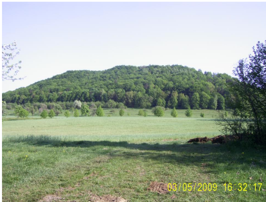
Рис. 2. Гора-останець Побійна поблизу с.Крехів

З геологічних пам'яток на території РЛП «Равське Розточчя» (див. рис. 1) слід відзначити цікаві відслонення у закинутих кар'єрах поблизу хутора Зелена Гута (1.1 – мергелі та опока маастрихтського ярусу зі скам'янілими рештками мешканців крейдового моря), с. Кам'яна Гора (1.2 – пісковики міоцену), с. Ниви (1.3 – кварцево-глауконітові піски міоцену), закинуті копальні з видобутку бурого вугілля у відкладах палеогену в урочищі Заглина поблизу с. Монастирок (1.4 – у териконах трапляються стовбури скам'янілих дерев, а у пластах вугілля – стовбури, іноді довжиною до 40 м і завтовшки до 1 м), г. Лиса (Гора Баба, 310 м) неподалік с. Борове (1.5 – сірі кварцеві піски міоцену з прошарками черепашникового вапняку), 1.6 – морена окського часу та ератичні валуни на пасмі Вовковиця південніше м. Рава-Руська.