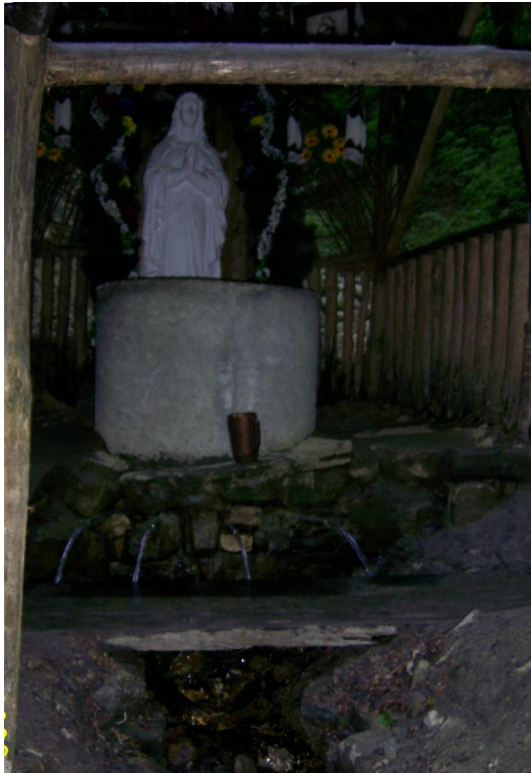
Рис. 4. Джерело Божої Матері в урочищі Рубаня поблизу Крехівського монастиря Fig. 4. Source of Vozha Matir in the tract of Ruban near Krekhiv monastery

Василіанського монастиря (XVII–XVIII ст.) поблизу с. Крехів і Маріїнський молодіжний духовний центр «Заглина» неподалік с. Монастирок.