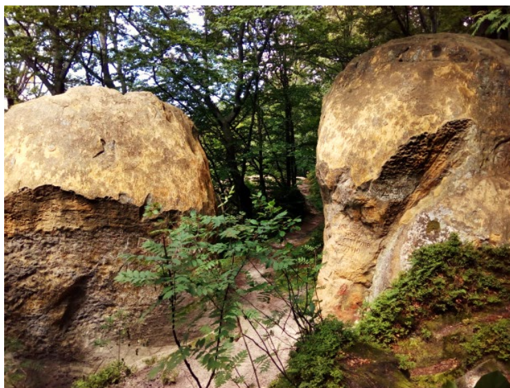
Рис. 4. Бічні скелі блокової форми, які нагадують стовпи брами (На задньому плані в прогалині видно вершину основної скелі)

Бічні скелі нагадують масивні стовпи брами, розташовані майже на одній лінії, вище і нижче по схилу (рис. 4). Належать до морфологічного типу блок. Висота сягає 5 і 3,8 м відповідно. Видовжені на 5–6 м, мають товщину 1,3–1,5 м, простір між ними розширюється догори від 1,0 до 1,7 м. Вершини скель згладженої форми, на них вплинули природні процеси вивітрювання, денудації та обточування вітром, дощем, снігом. Стінки неодноразово штучно обтесували каменярі. На скелі, розташованій нижче по схилу, видовбані різного розміру виїмки-сходинки, якими могли підніматися на вершину вартіві. Стінки скелі, розташованої вище по схилу, з північного боку “прикрашені” природними утвореннями – ділянками сотового вивітрювання і штучно видовбаним православним хрестом. Природні форми та елементи тут поєднуються з антропогенними (рис. 4).