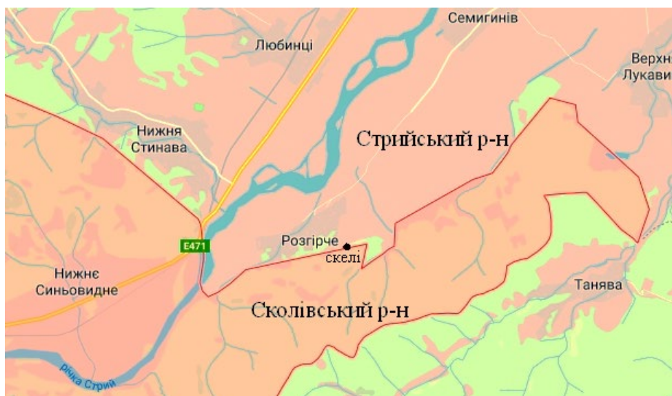
Рис. 1. Місцєположеннє скель та с. Розгїрче на адмінїстративнїй картї Fig. 1. Location of cliffs and willage Rozhırche on the administrative map

призначення часів Середньовіччя. У зв'язку з розвитком активного туризму в країні останніми роками цей об'єкт приваблює щораз більше туристів, а також людей, які хочуть знати історію краю та своє походження.