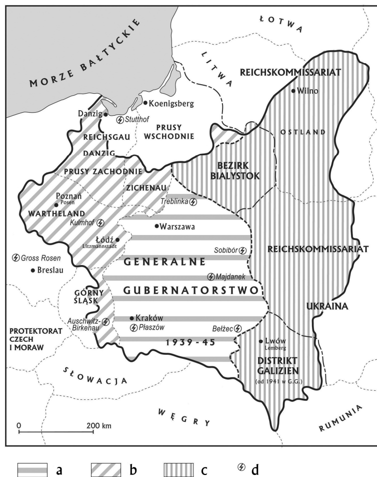
Рис. 5. Польща під німецькою і совєцькою окупацією 1939-1944. За Н. Девісом (2003) із змінами. а – Генерал-губернаторство із столицею в Кракові; б – території, включені до III Рейху у вересні 1939 р.; с – території, включені до Радянського Союзу (1939-1941) і поділені на німецькі адміністративні округи в 1941-1944 рр.; d – основні німецькі концетраційні табори.

іншого львів'янина, який має заслуги у сфері охорони пам'яток, в тому числі й археологічних 20 .