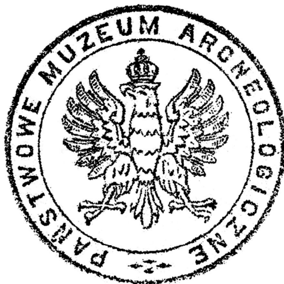
Рис. 4. Урядова печатка Державного археологічного музею у Варшаві, створеного у 1928р.

“Він був останнім “прадавнім” типом з половини XIX століття, якого цікавило минуле певної, чітко окресленої географічної території. Дуже здібний, повний запалу і самопожертви отримав у праці менші результати, ніж міг би отримати в інших умовах” 9 .