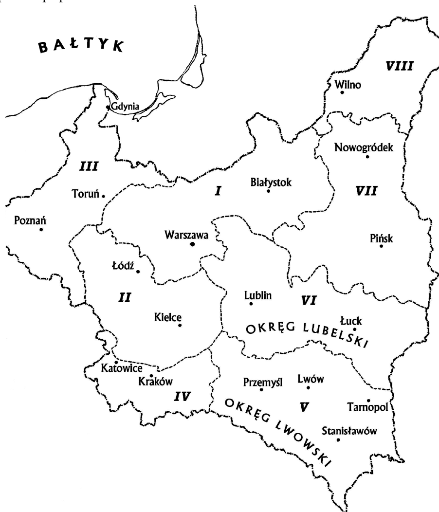
Рис. 2. Округи охорони пам'яток в Польській Республіці відповідно до їх границь, встановлених 25. VI. 1925 р. Територія Західної України в межах Польської держави знаходилась у Львівському Окрузі (V) і Любелському Окрузі (VI). За Б. Столпяк (B. Stolpiak) опрацював Т. Піотровські (T. Piotrowski).

зібрана щораз більша кількість пам'яток 3 . Органом PGKZP від 5-го тому став збірник "Археологічні Відомості", який продовжував таким чином традиції першого польського доісторичного журналу, що видавався в XIX столітті у Варшаві графом Яном Завішою.