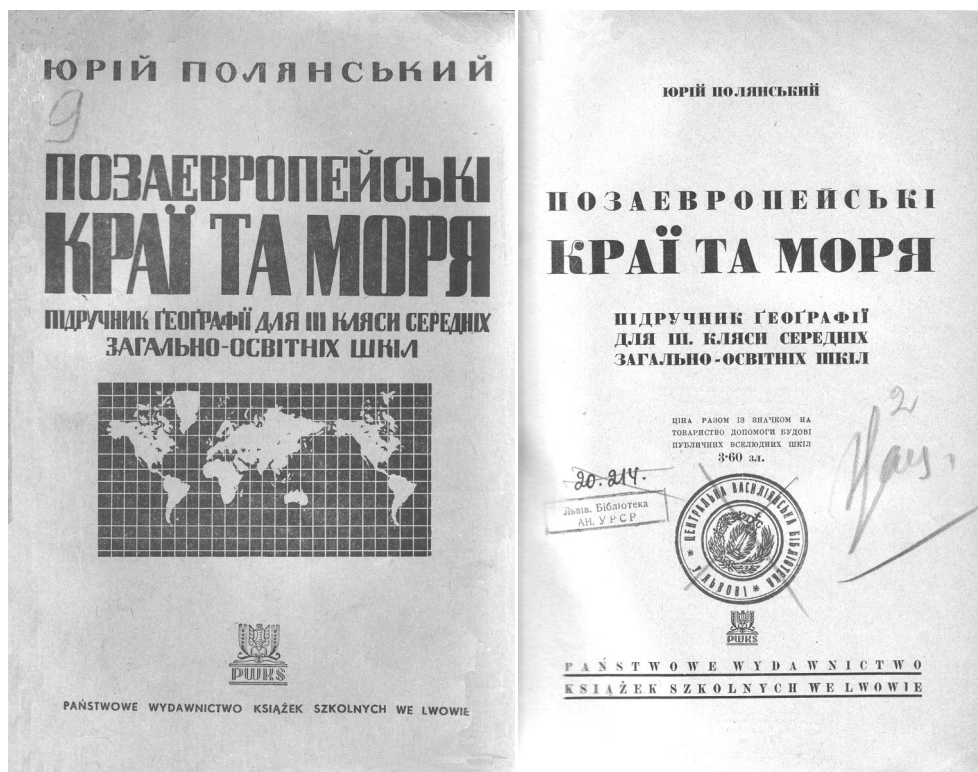
Рис. 2. Титул та фортикул підручника з географії “Позаєвропейські краї та моря”, виданого Ю. Полянським у 1938 р.

дослідника-польовика Ю. Полянського, який і в еміграції плідно працював на благо науки.