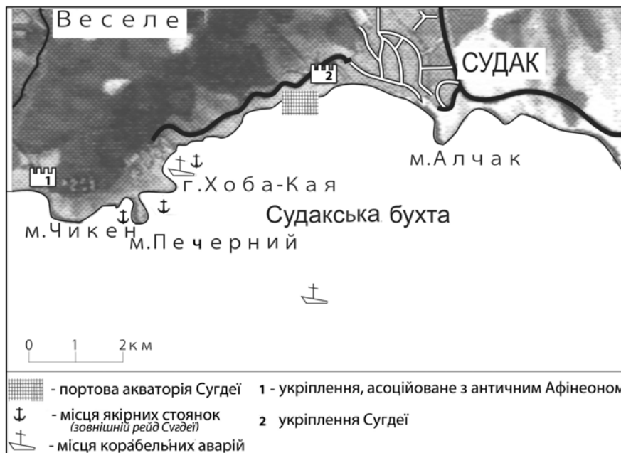
Рис. 1. Локалізація об'єктів, пов'язаних із функціонуванням порту середньовічної Сугдеї.

70 ISSN 2078–6093. Археологічні дослідження Львівського університету. 2012. Випуск 14–15 узбережжі Таврики [Прокопий, 1939, с. 249–250]. За наступників Юстиніана I в адміністративну систему Візантійської імперії долучено й Боспор [Храпунов, 2005]. Відтоді активна діяльність Сугдейського порту фіксується як комплексом сфрагістичних матеріалів з міського архіву Сугдеї, так і археологічними матеріалами. Вважається, що Сугдея розвивалася в якості укріпленої портової слободи, покликаної забезпечувати морське сполучення уздовж Кримського узбережжя, задіяного в активному торговельному обміні [Баранов, 1989].