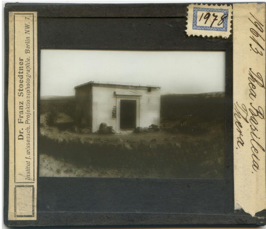
Рис. 1. Діапозитив із колекції Музею історії Львівського університету.

новий спосіб ілюстрації в науково-педагогічних цілях можна вважати курс лекцій Клерка (1848 р.) у Політехнічному інституті Лондона в супроводі магічного ліхтаря. Їх успіх був настільки великим, що ця практика поширилася на Францію та Німеччину. У 1864 р. деякі курси в Сорбонні ілюстрували проєкціями [Садуль, 1999]. Однак найчастіше проєкцію використовували для жартівливих вистав, декламації видатних творів літератури чи казок, для супроводу виконання релігійних гімнів та благочинних вистав у церквах чи сиротинцях.