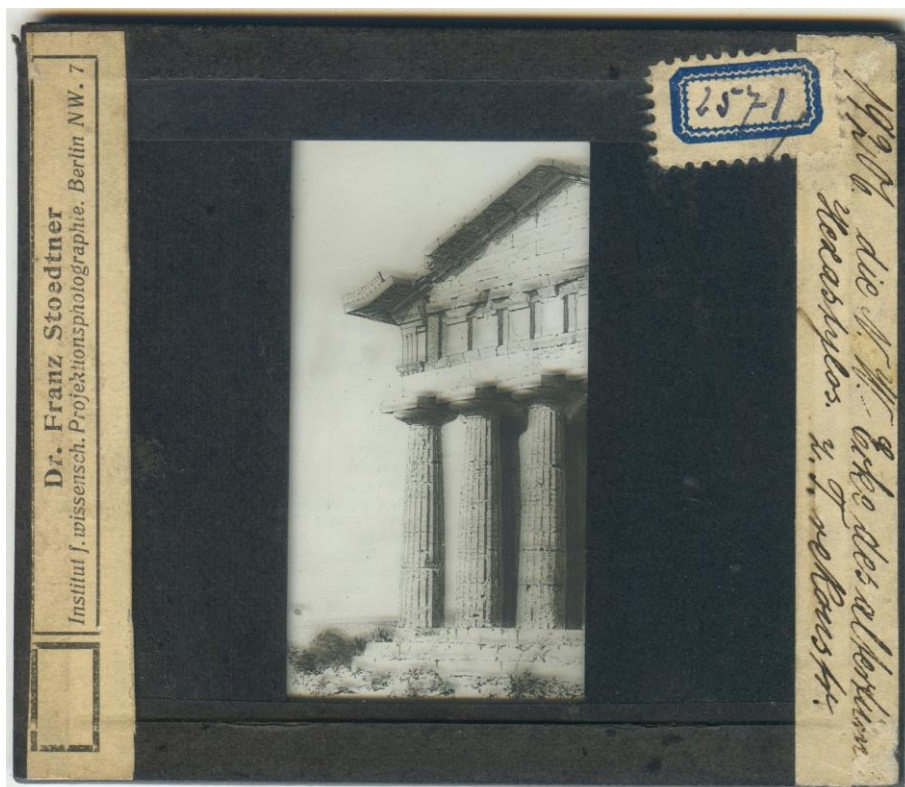
Рис. 2. Продукція “Інституту наукових проєкцій” Франца Штудтнера в колекції діапозитивів Музею історії Львівського університету.

Завдяки співпраці з др. Анке Напп, керівницею медіатеки Гамбурзького університету, встановлено, що діапозитиви з фондів Музею історії Львівського університету були виготовлені в різні роки. Декілька екземплярів були виготовлені 1904 р., найбільша ж кількість із досліджених датується 1917 та 1919 рр. Значна партія зразків була закуплена в 1920–1929 рр. Загалом у фондах поки що виявлено 29 відповідних діапозитивів. Виникає питання, як відбувалася закупівля діапозитивів і хто з працівників Університету був ініціатором цього процесу? Однак сьогодні однозначну відповідь ще не сформовано. Із відомостей Німецького державного архіву фоно- і фотодокументів відомо, що професори зверталися до “Інституту наукових проєкцій” з проханням надіслати каталог. Для ознайомлення з каталогом чи зразком альбомів із фотографіями давалося вісім днів. А. Напп зауважила, що в архіві є численні скарги на протермінування повернення зразків чи