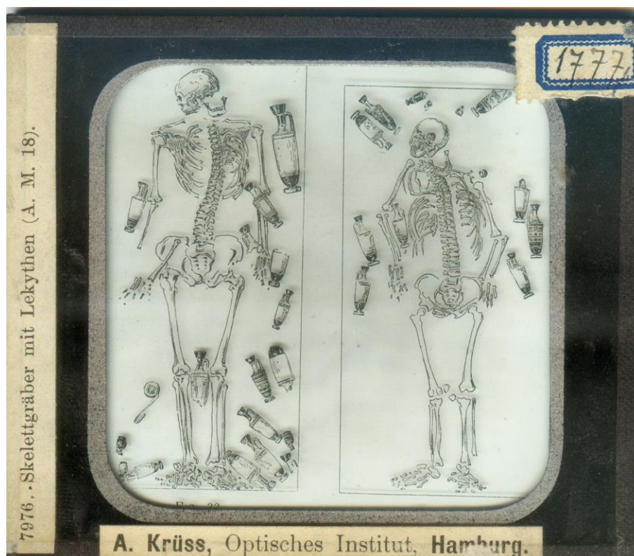
Рис. 3. Діапозитиви, виготовлені “Оптичним інститутом” Андреаса Крюсса з колекції Музею історії Львівського університету.

каталогів. Також можна було особисто ознайомитися з якістю слайдів і продукції, відвідавши саме виробництво. За обраними номерами зразків виготовляли слайди і відправляли в місце призначення у спеціальному упакуванні. Оскільки ця процедура могла зайняти кілька тижнів, то професори мали заздалегідь планувати їх використання в лекціях. У перші післявоєнні роки на виготовлення слайдів йшли місяці, але все-таки виробництво та постачання не припиняли. Однак у колекції нашого університету на сьогодні відсутні зразки, датовані другою половиною 1940-х років.