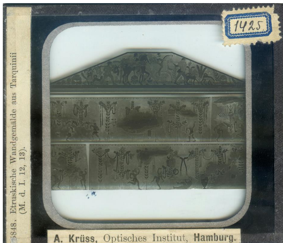
Рис. 5. Розпис етруського поховання на діапозитиві з колекції Музею історії Львівського університету.

Частина діапозитивів могла бути ілюстраціями для досліджень та лекцій Івана Старчука. Саме він зосередив свою увагу на вивченні та публікаціях про вівтар на честь римської богині миру Пакс (Ara Pacis Augustae), споруджений після тріумфального повернення імператора Августа з Іспанії та Галлії у 13 р. до н. е. [Starczuk, 1937; 1938]. На Першій науковій сесії Львівського державного університету імені Івана Франка, що відбулася наприкінці січня–на початку лютого 1941 р., І. Старчук виголосив доповідь, присвячену саме цій темі – “Жертва Енея на “Ara Pacis” Августа в Римі” [Програма праць..., 1941, с. 1–2].