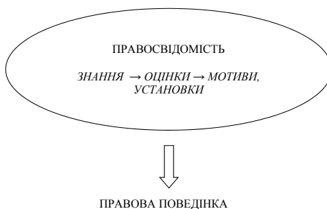
Рис. 1. Структура правосвідомості та її взаємозв'язок з правовою поведінкою

функціонування правової системи, органів юридичної сфери), другий – включає оціночне сприйняття правової дійсності (діяльності правоохоронних та судових органів, рівень довіри до них, оцінка засобів задоволення своїх законних потреб та захисту інтересів, сприйняття права як цінності тощо), третій – установки та мотиви, що є основою поведінкових моделей особистості та готовністю до дії. Без сумніву, всі компоненти між собою тісно пов'язані, зокрема знання формують оціночні ставлення, а останні є основою мотивів поведінки (правомірної чи протиправної) соціальних суб'єктів.