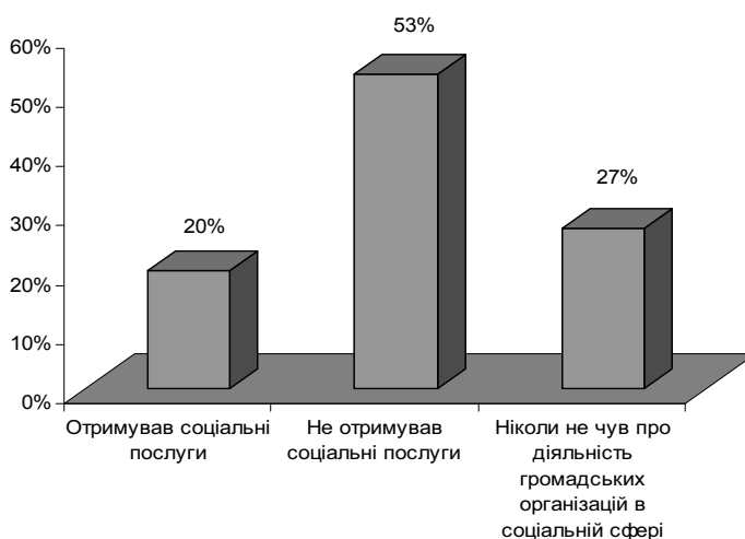
Рис. 1. Показник отримання соціальних послуг від громадських організацій

Як видно з рис. 1, досить незначна частка населення Запорізького регіону зверталася або отримували послуги від громадських організацій.