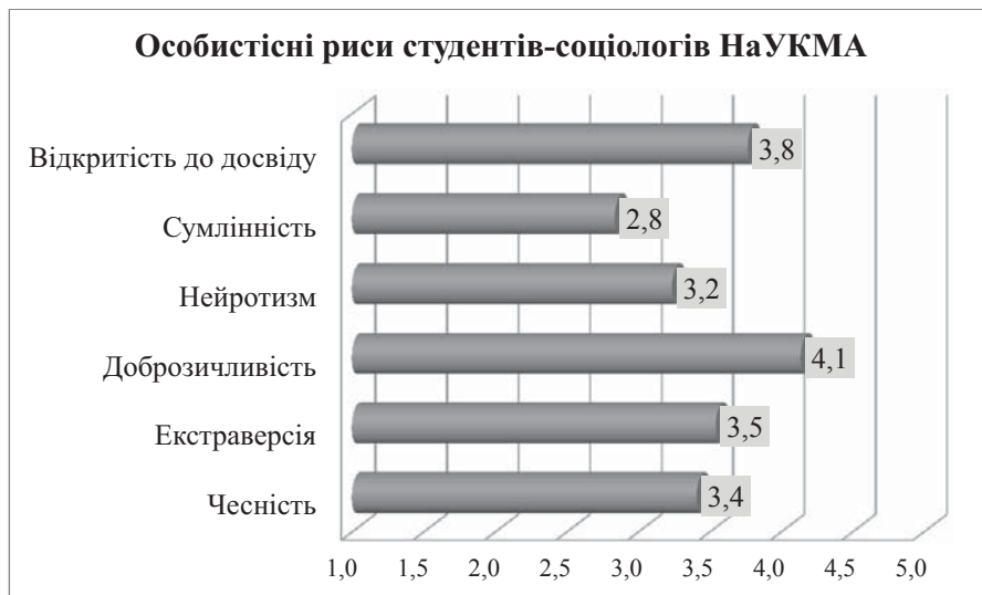
Рис. 1. Ступені прояву особистісних рис студентів-соціологів НаУКМА 1 року навчання

Результати опитування представлені на рисунку 1.