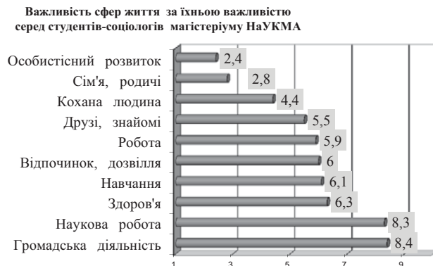
Рис. 3. Важливість сфер життя для студентів-соціологів НаУКМА 2 року навчання магістеріуму

Цікаво, що між середніми значеннями рангів цих сфер життя студентів бакалаврату різних років і студентів магістеріуму статистично значущих відмінностей виявлено не було. Однозначно спростувати висунуту гіпотезу наразі неможливо, через невелику вибірку студентів магістеріуму.