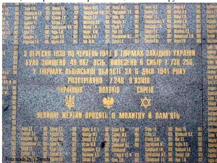
Рис. 3 Меморіал на Замарстинові

Іншою великою групою недавно збудованих у Львові пам’ятників є монументи, присвячені жертвам радянського чи нацистського режимів (жертв Голокосту, Голодомору, ГУЛагу, НКВС і гестапо). Однак лише декілька з них вшановують неукраїнські національні групи поряд з українцями (рис. 3). Більшість з них адресовані жертвам загалом, не вирізняючи окремих національних груп.