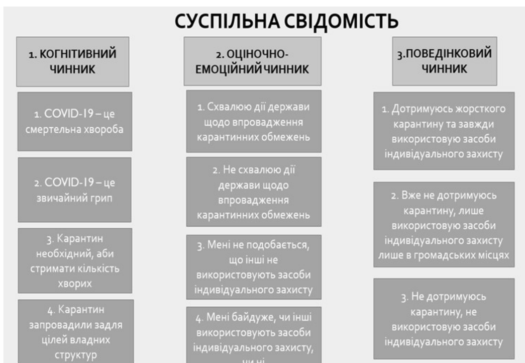
Рис. 1.1. «Дискурси та їх ймовірний вплив на формування моделей поведінки»