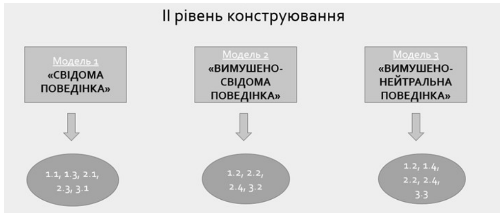
Рис. 1.2. «Дискурси та їх ймовірний вплив на формування моделей поведінки»

Як відомо, дискурси конструюються, у цьому випадку – низкою інституцій: влада (президент, уряд), Міністерство охорони здоров’я України, лідери думок, засоби масової інформації (телебачення), громадська думка та ін. Таким чином створюється перший рівень конструювання дискурсів у свідомості населення – це один із способів, шляхом якого об’єктивна дійсність пропонується до сприйняття та виражається у суб’єктивних судженнях. Оскільки дискурси мають безпосередній зв’язок із поведінкою та подальшими діями індивідів, то можна стверджувати, що конструюючи ці дискурси та розповсюджуючи їх в українському дискурсивному полі, інституції звершують маніпулятивний вплив шляхом зміни поведінки індивідів задля досягнення власних цілей.