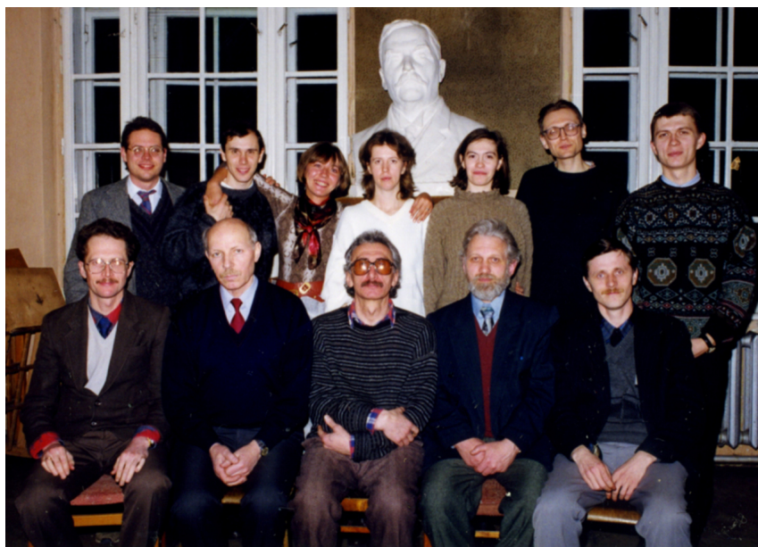
Фото 10. Працівники ПНДЛМЕ та Кафедри музичної фольклористики.

вача та 3-х старших лаборантів (двох лаборантів із вищою освітою та однієї без) 1 . У грудні того ж року в Консерваторії була заснована одна з перших у Східній Європі кафедр музичної фольклористики 2 . Тоді ж Л. Кушлика, який став старшим викладачем цієї кафедри, на посаді завідувача Лабораторії змінив Тарас Брилинський [37]. У грудні 1992 року наказом Міністерства культури України була створена Проблемна науково-дослідна лабораторія музичної етнології [34].