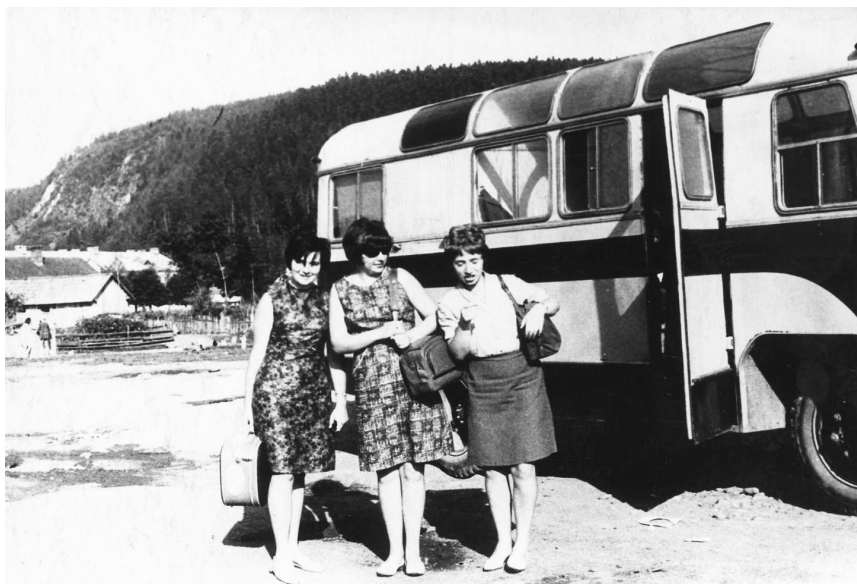
Фото 5. Студентки Львівської консерваторії – учасниці музично-етнографічної експедиції у селі Тухолька Сколівського району Львівської області. Експедиція Консерваторії № 19 (1 сеанс). 1967 рік.

Також завдяки В. Гошовському в середині 1960-х років Кабінет налагодив стосунки із подібними закладами Мінська, Вільнюса, Москви, Братислави, Брно, Будапешта та Варшави [2, с. 369].