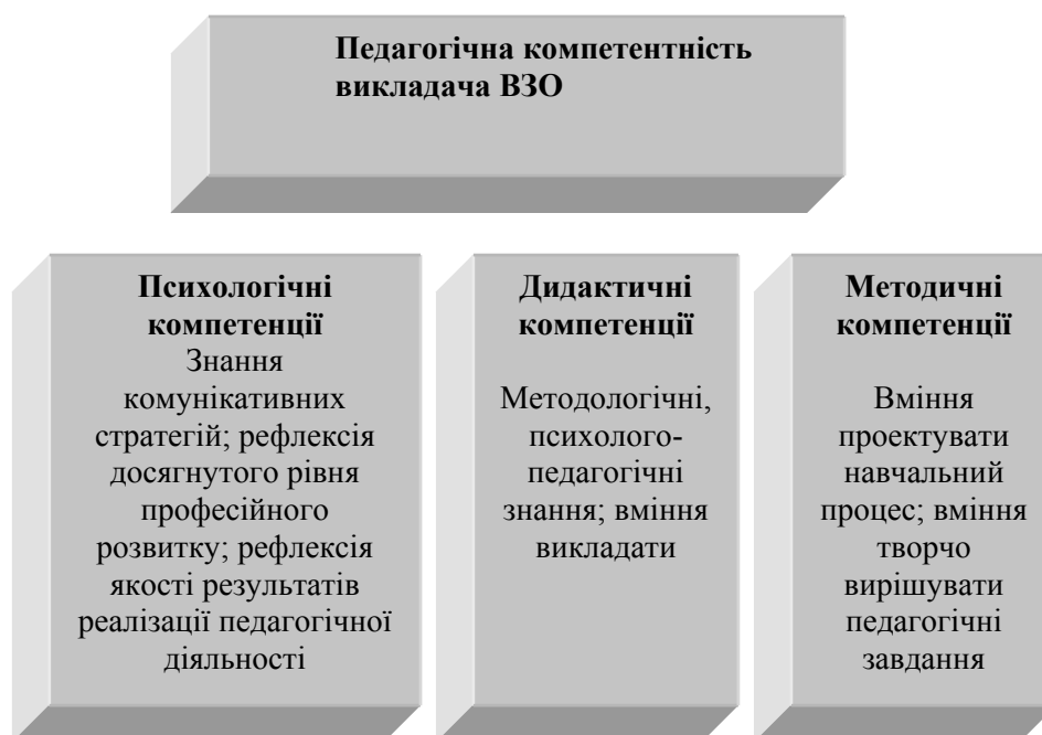
Рис. 2. Структура педагогічної компетентності викладача ВЗО (за О. Патріною)

І.Трешина вважає, що професіональна компетентність викладача іноземної мови реалізується як синтез, нероздільна єдність змістовного та структурного компонентів, які проявляються через професійно-лінгвістичну, соціальну, компенсаторну та особистісні риси. Професійно-лінгвістична компетенція охоплює психолого-педагогічну, частину якої становить методична й філологічна компетенції. До складу філологічної компетенції відносять лінгвістичну, соціокультурну й загальногуманітарну компетенції [7, с. 35].