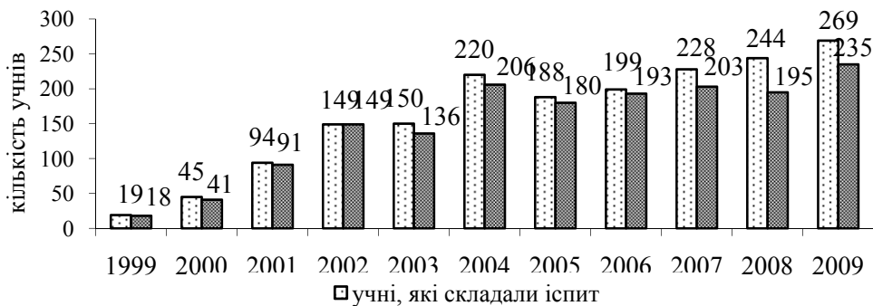
Рис. 3. Кількість учнів, які склали DSD-іспит; отримали мовний диплом

Вважаємо, що про позитивні результати діяльності DSD-шкіл свідчить те, що 20 із 33 спеціалізованих шкіл співпрацювали із координаторами проекту, а також статистичні дані про кількість учнів, які брали участь у складанні DSD-іспиту, а також показники успішності його складання [7] (рис. 3).